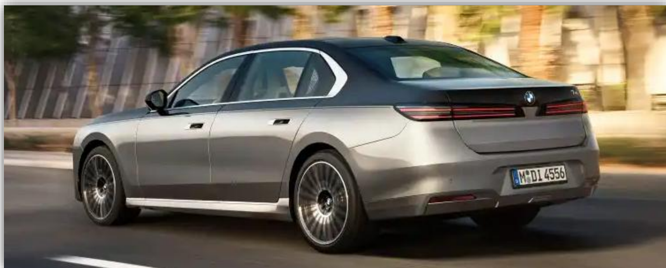
Tvåtonslack för den som är ambivalent vid färgvalet

Svenska priser är ännu inte klara. Utgående i7 börjar på 1 338 000 kronor (bakhjulsdriven, vilket nu försvinner). Laddhybriderna börjar på 1 410 700 kronor. Bensin- och dieselvarianterna säljs inte i Sverige.