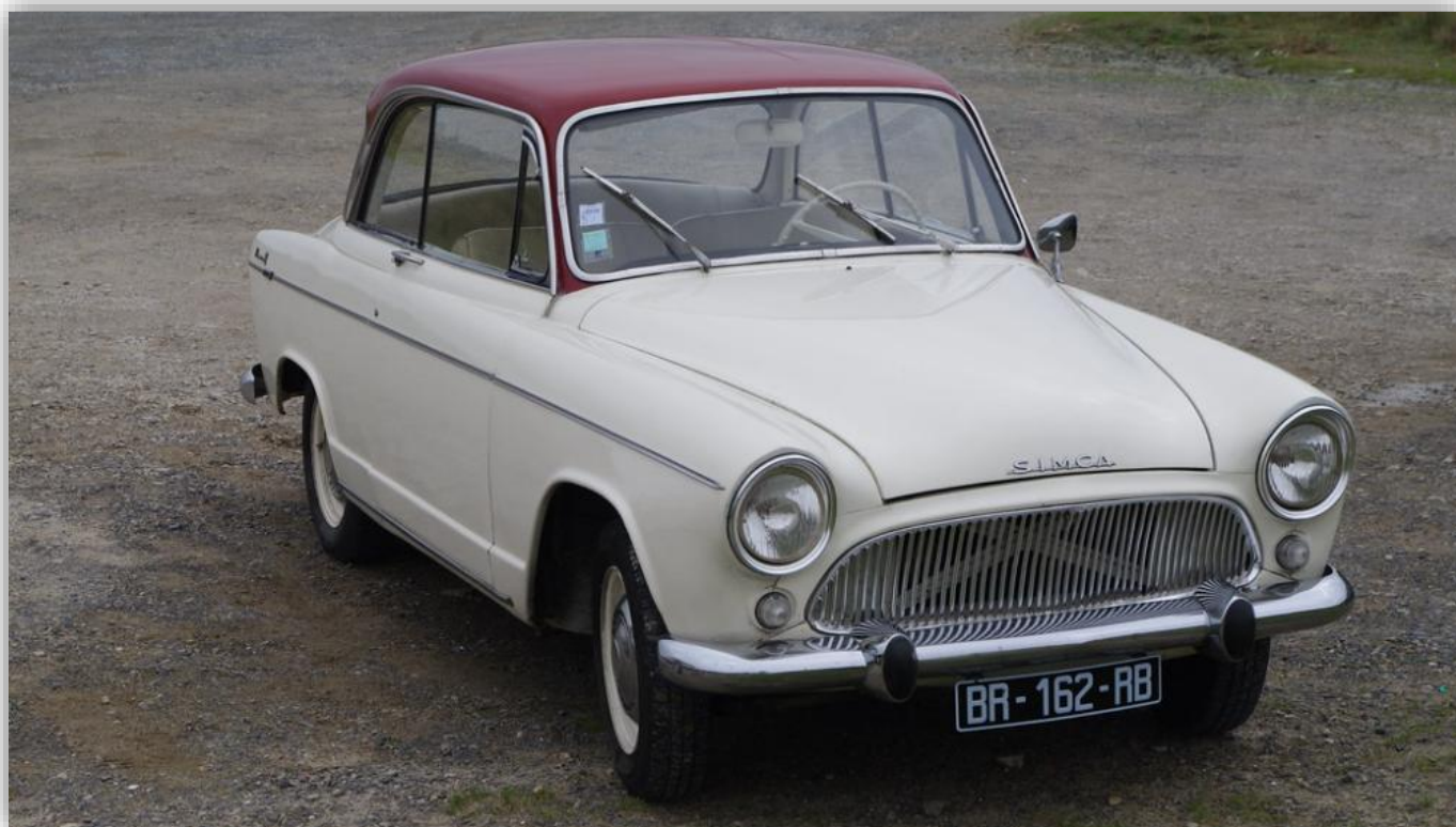
Simca Aronde P60 Monaco Spéciale 1962

Varje dag firar vi en ny bilnamnsdag. I dag när Monika och Mona har namnsdag vill vi rikta strålkastaren mot Monaco.