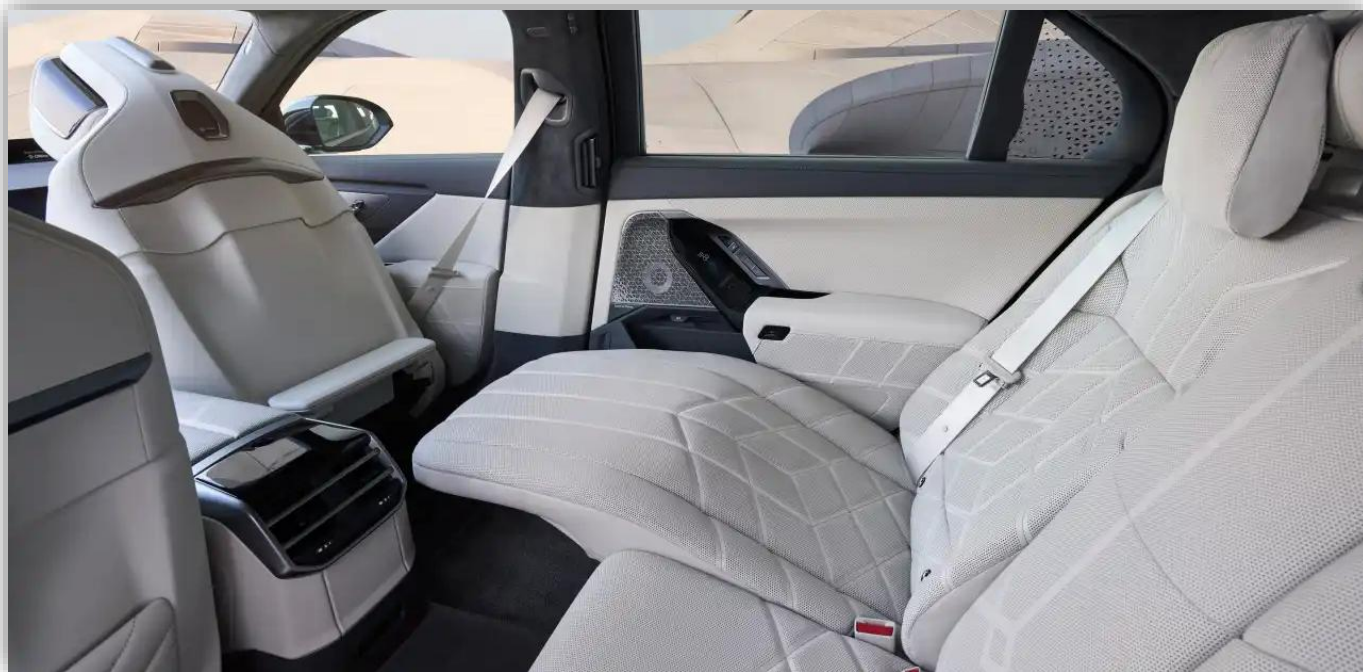
Komfort i baksätet