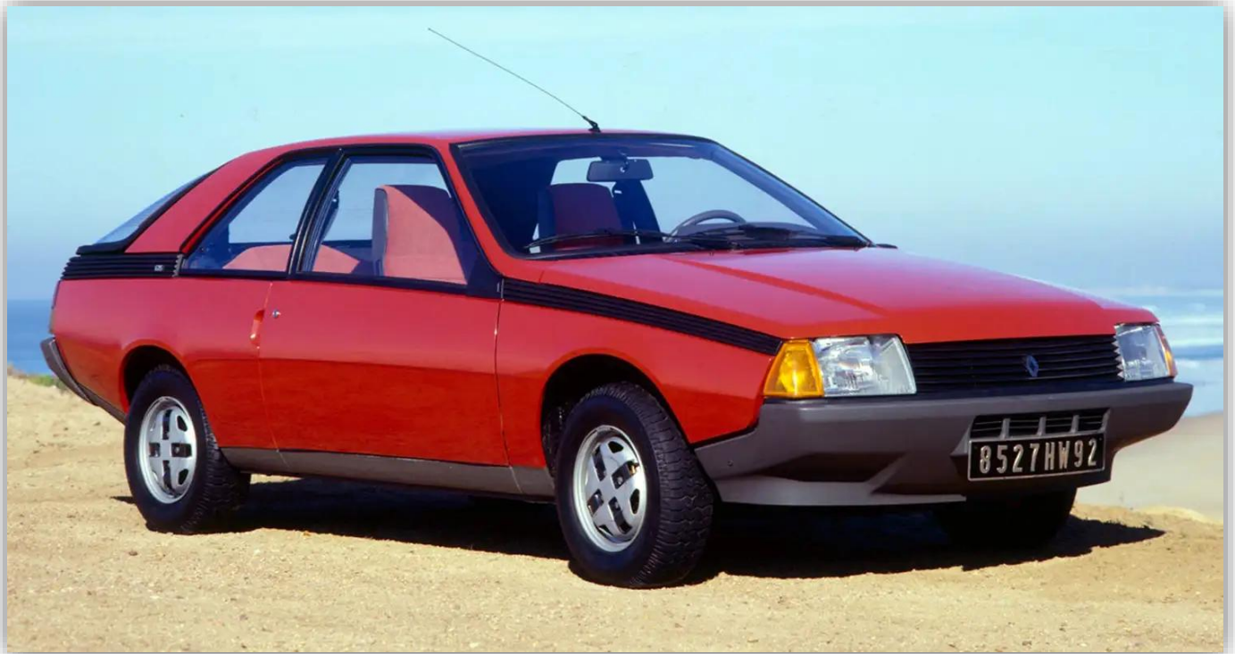
Renault Fuego Turbo Diesel (1984)