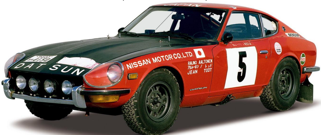
Fairlady Rally 1971–73