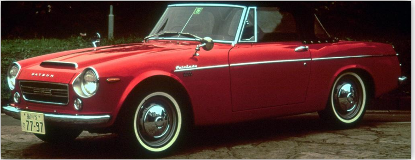
Nästa generation (1967–70) visste mer vad den ville. Lite Spridget, lite Triumph, mycket snygg!