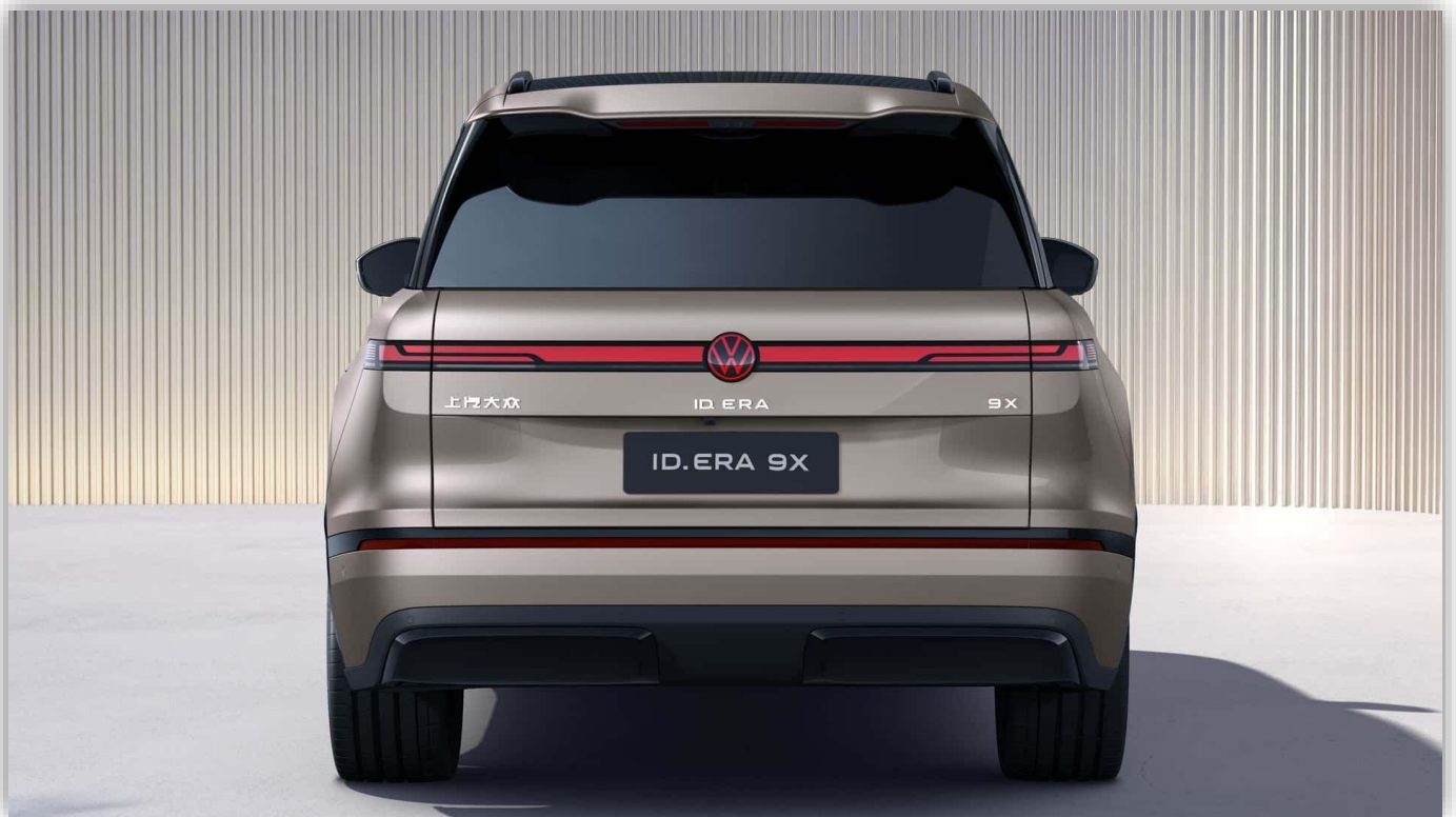
Än så länge är ID. Era 9X avsedd för Kina, men tekniken kan hitta till fler marknader