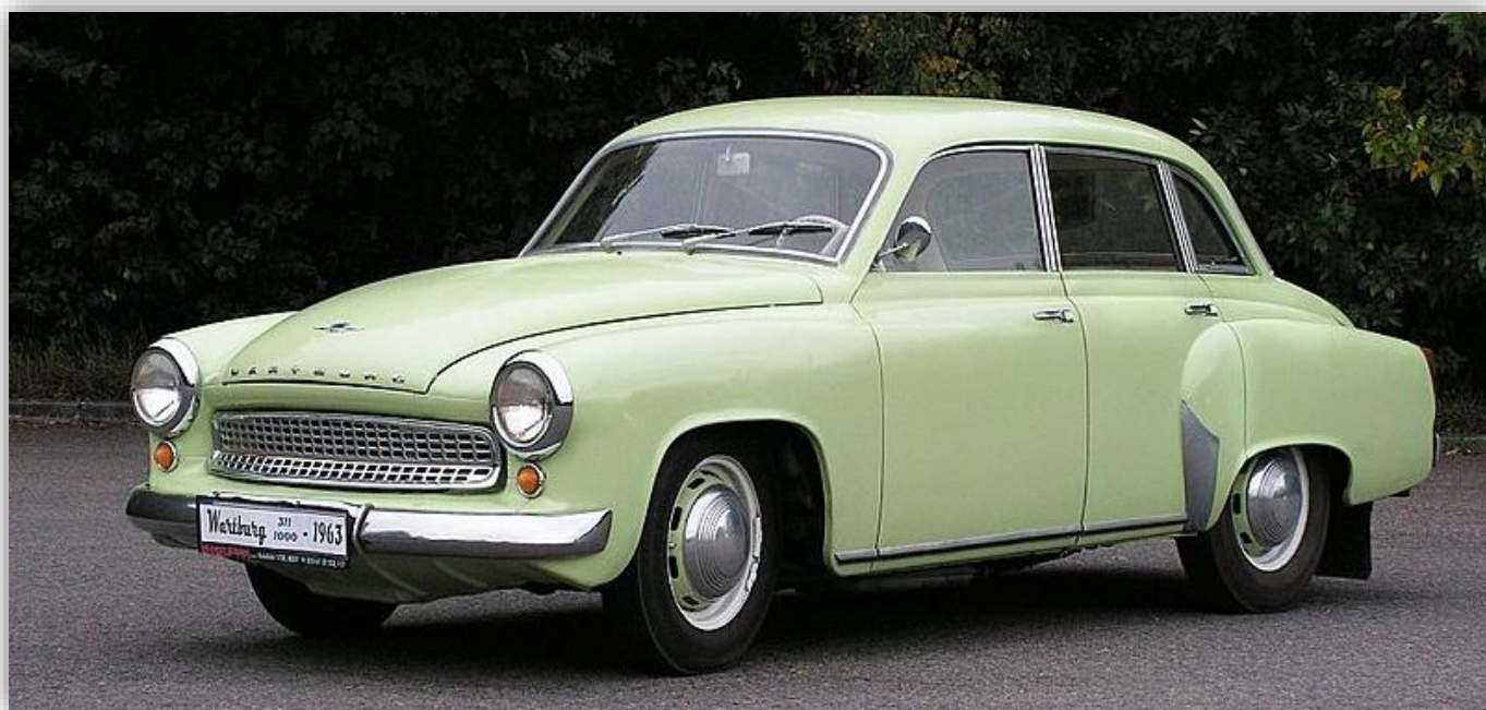
Wartburg 353 1.3

Efter att Wartburg 311 och 312 redan fanns tillgängliga som kombiversion, efterfrågade allt fler kunder en sådan för 353 också. Det tog dock två år innan 353 Tourist dök upp på marknaden. Innan dess fortsatte 312 Kombi (två dörrar) och 312 Camping (fyra dörrar) att rulla av produktionslinjerna i Halle och Dresden parallellt med 353 sedan. Dessa produktionsplatser togs över för den nya modellen, som dock endast fanns med fyra dörrar. Till skillnad från sedanen var bakskärmarna och bakluckan på Tourist gjorda av glasfiberarmerad plast. Från 1970 var C-stolparna utrustade med tvångsventilation för interiören. Det fanns plats för upp till 1 800 liter bagage i den förstorade bagageluckan, medan sedanen fortfarande rymde 500 liter. "Standard" och "de Luxe" utrustningsnivåerna fanns också tillgängliga för 353 Tourist, liksom tillval som soltak. Från 1984 ersattes "de Luxe" av 353 S (S på specialbegäran). Det fanns också Pick-Up-varianter och två specialfordonstransporter för rallyteamet.