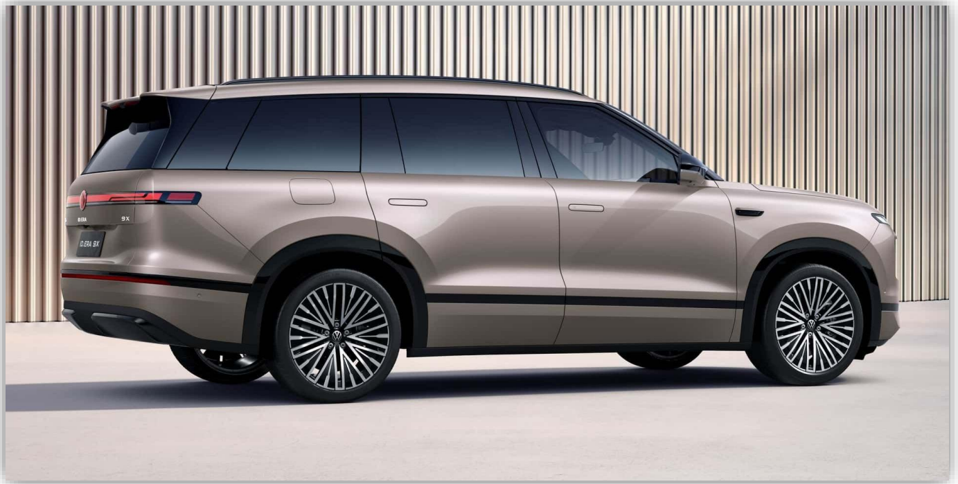
Med en längd på över 5,2 meter placerar sig ID. Era 9X i full-size SUV-segmentet