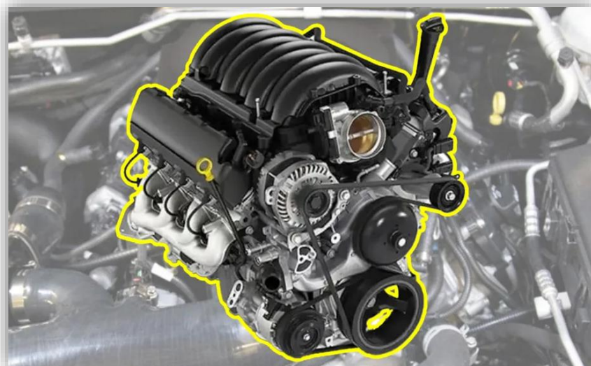
General Motors har återkallat över 600 000 V8-motorer

Efter skandalen har General Motors mottagit ett flertal stämningar och i slutet av förra året bestämde sig en domare för att slå samman ett stort antal stämningar till ett enda massivt mål. NHTSA fått in över tusen rapporter om allt från lagerhaverier till fastlåsningar i vevpartiet. Felet berör modeller som Chevrolet Silverado och Suburban, GMC Sierra och Yukon samt Cadillac Escalade. Det är pickuper som i USA ofta används som arbetsredskap och familjebil på samma gång. Men trots återkallelsen fortsatte anmälningarna att strömma in. Och även nya modeller som inte omfattas av återkallelsen har visat sig ha fel.