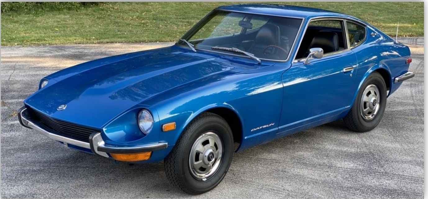
Den bil som satte Datsun på kartan som sportvagnstillverkare var 240Z. I Japan hette den Fairlady.