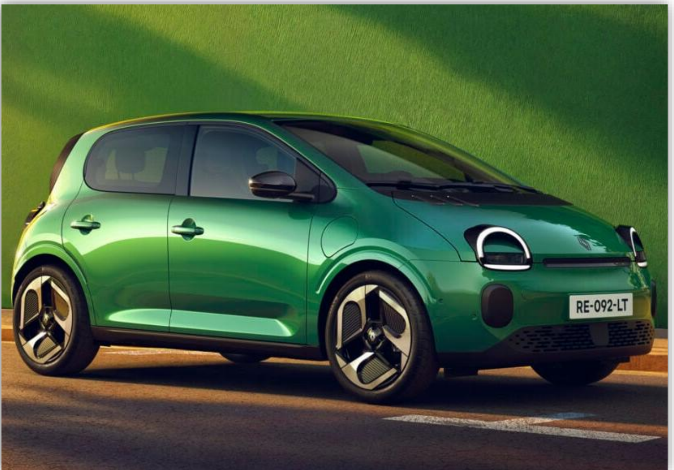
Vi har ännu inte fått så många specifikationer, som längd och vikt, men Renault berättar att Twingo får en elmotor på 80 hästkrafter.