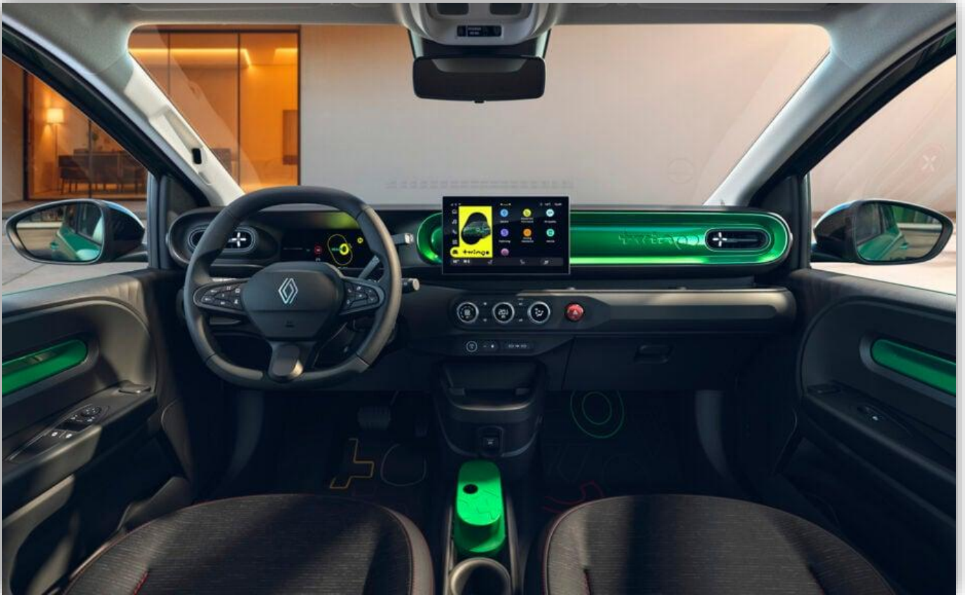
Metallinlägger påminner om ur-Twingo som hade lackad plåt i delar av inredningen