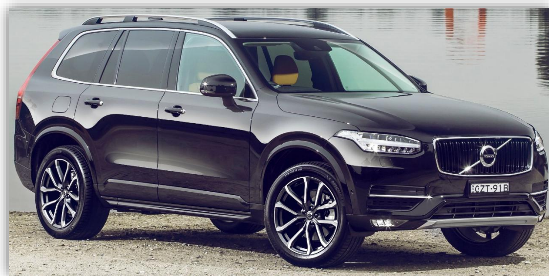
2016 Volvo XC90