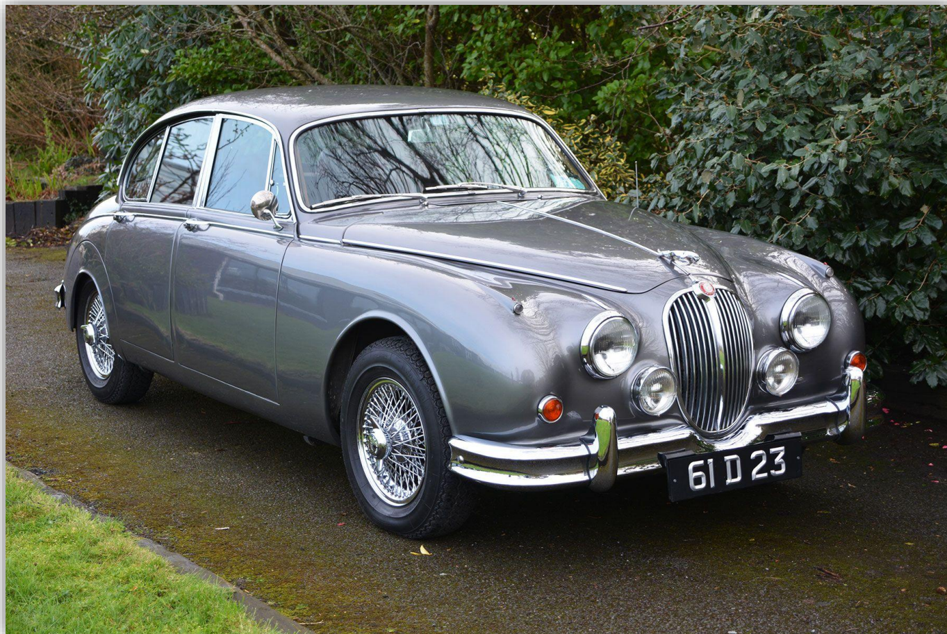
Jaguar Mark II 1961