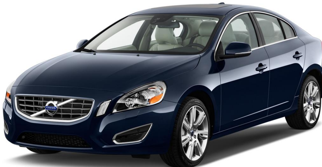
Volvo S60 2012