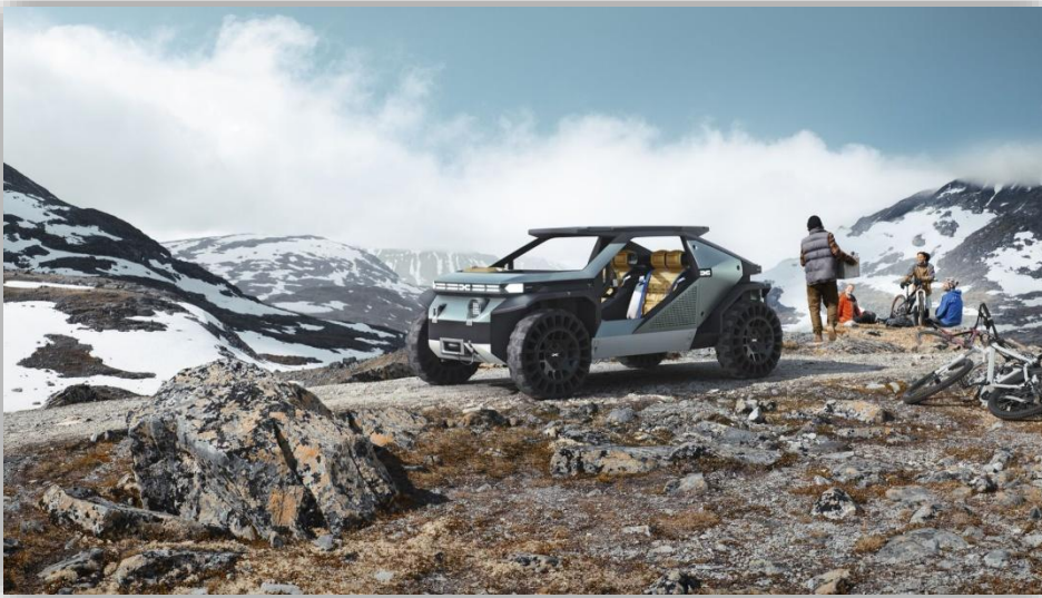
Concept Car Design of the Year gick till Dacia Concept Car Design of the Year gick till Dacia