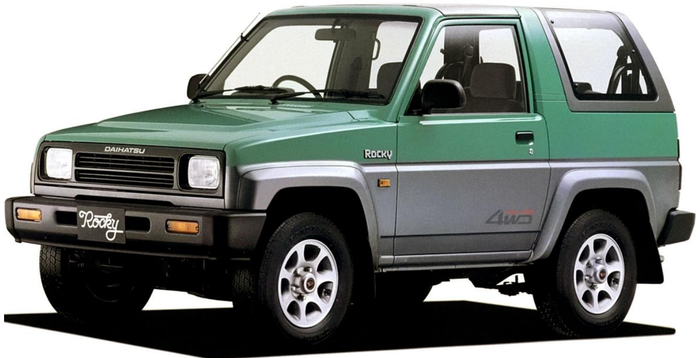
Daihatsu Rocky SX Full-Time 4WD (F300S) 1990–93

1993 genomfördes en större uppdatering av Rocky som behölls till 2001 då modellen lades ner eftersom Daihatsu valde att satsa på småbilar i stället.