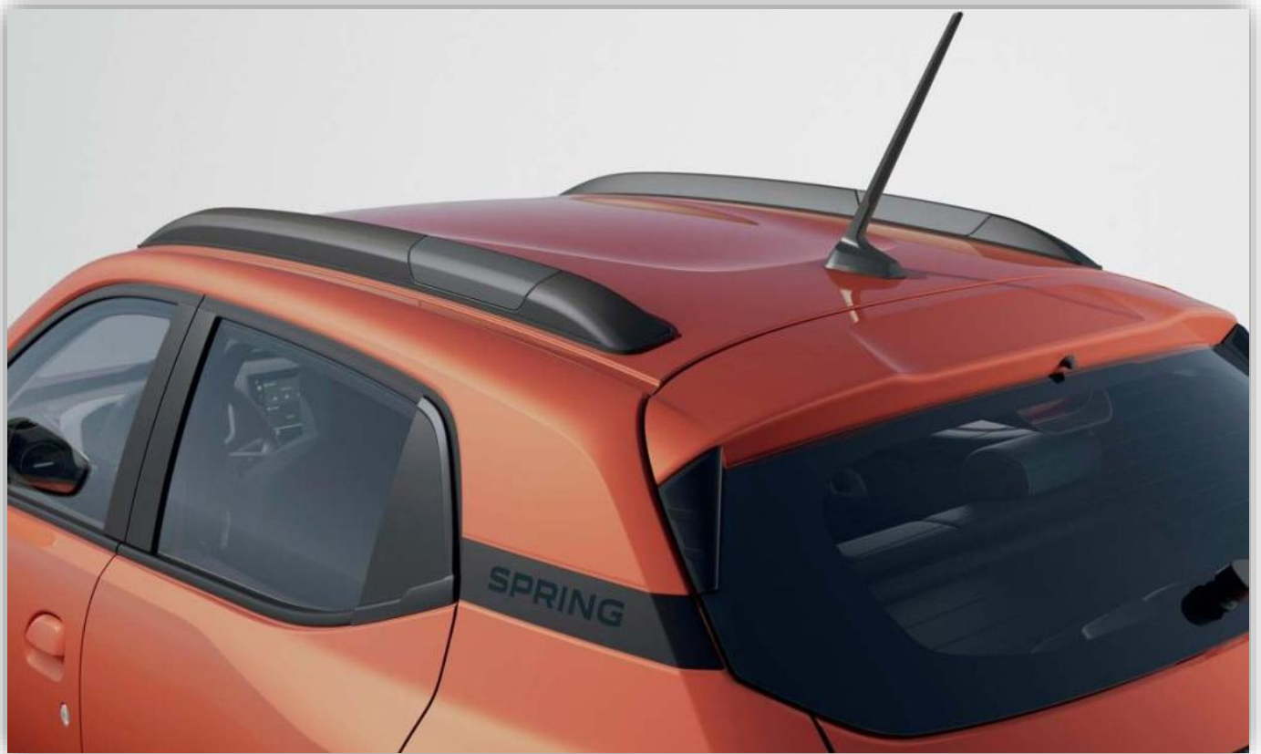
Ny bakspoiler förbättrar räckvidden