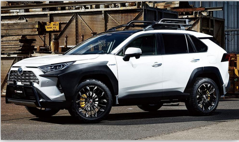
Toyota RAV4 laddhybrid återkallas i Sverige – kan få...