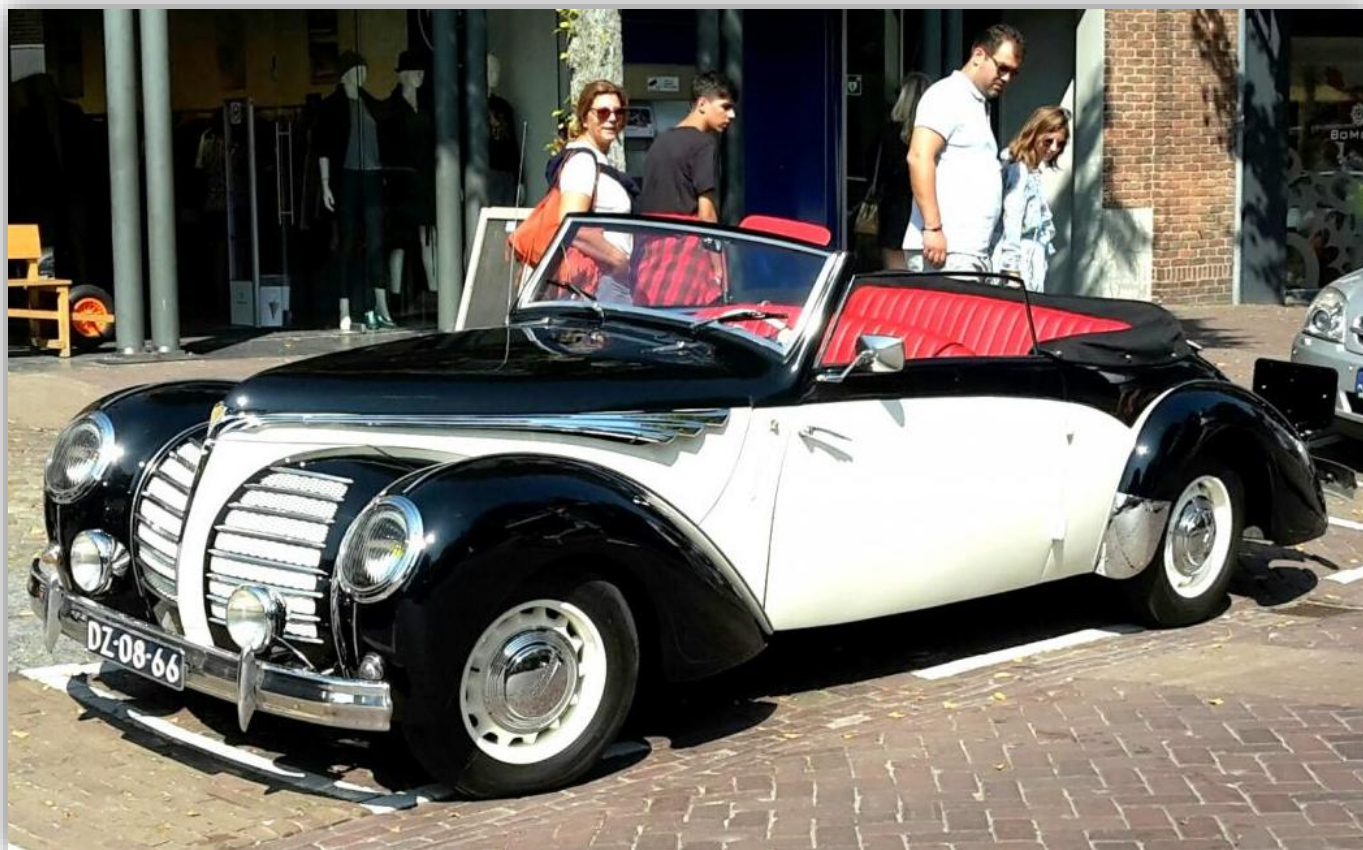
Rosengart Supertraction 1939