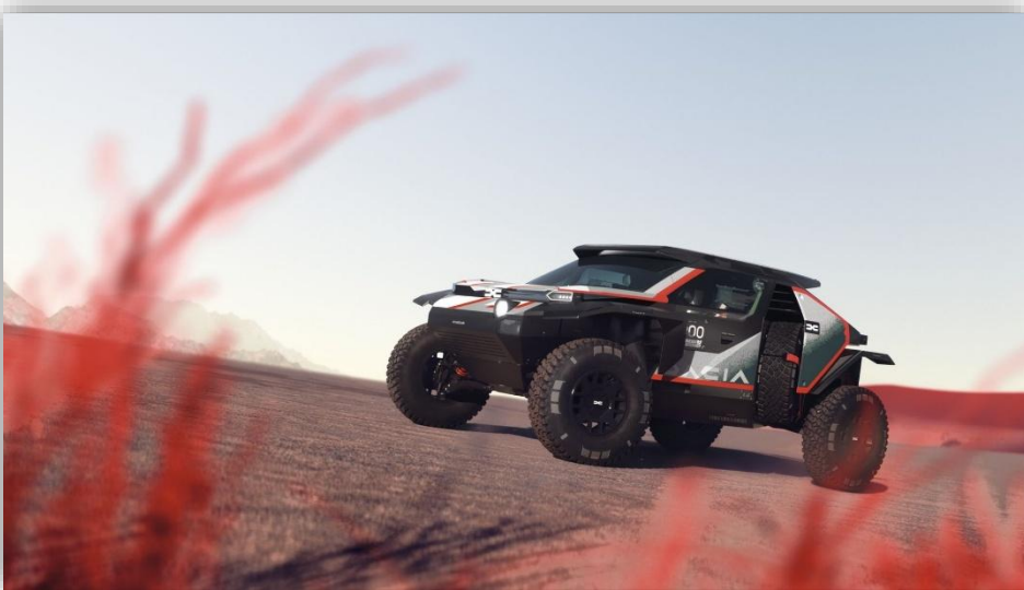
Dacia visar upp prototypen Sandrider Kommer att köras av Dacias förarteam i Dakar Rally