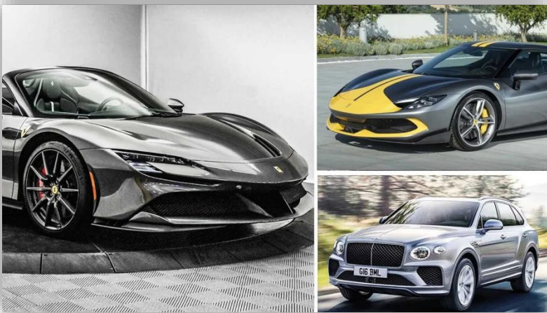
Jättekupp i Sverige: Superbilar för 13 milj stulna