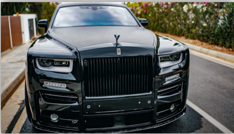
Svenskens nya vrååk – världens svartaste Rolls-Royce