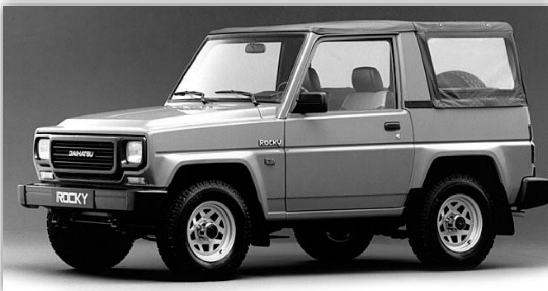
Daihatsu Rocky Soft Top 1987–93

Rocky såldes på vissa marknader som Daihatsu Feroza och fanns kort som lång samt som pickup.