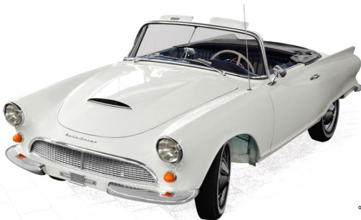
Auto Union 1000 Sp