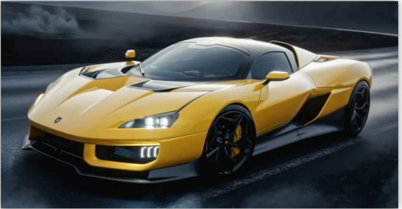
Gallerier: Giamaro Automobili Katla (2025)