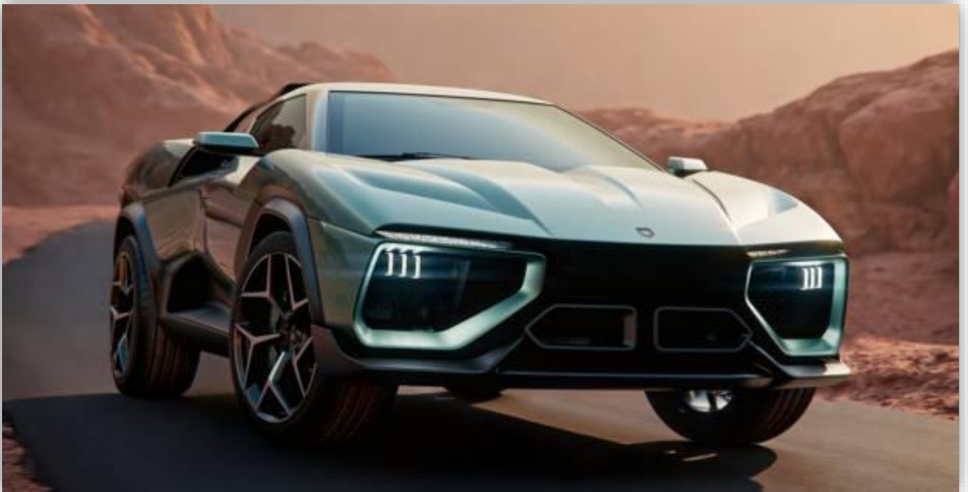
Gallerier: Giamaro Automobili Albor Concept (2025)