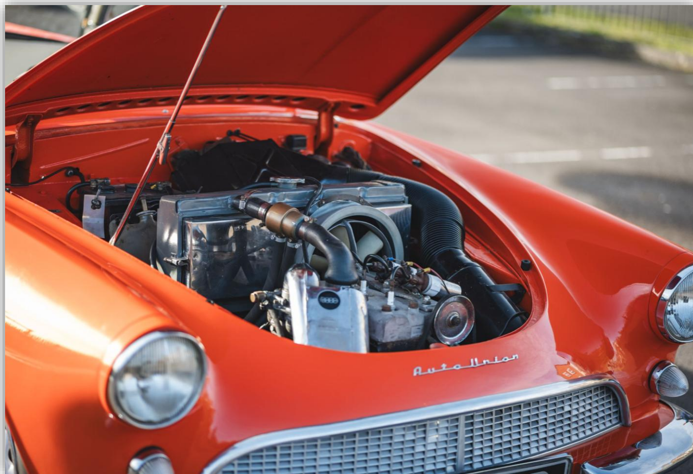
Kraften tillhandahålls av en Auto Union 981cc tvåtakts inline-trecylindrig 55 hk motor med en tvåcylindrig förgasare.

Modellnamnet kom från det faktum att bilen drevs av en 1000cc (egentligen 981cc) tvåtakts inline-trecylindrig 55 hk motor med en tvåpipig förgasare som var monterad framtill och drev framhjulen via en 4-växlad manuell växellåda. Auto Unions reklam brukade proklamera att motorn hade "bara sju rörliga delar!" – tre kolvar, tre vevstakar och en vevaxel.