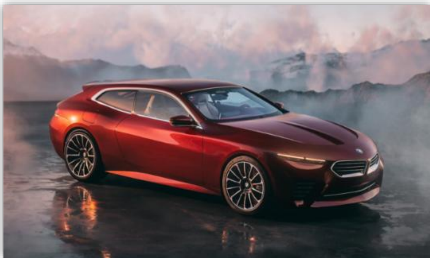
BMW Concept Speedtop.

På den italienska Rivieran avtäcker BMW en exceptionell nyhet. En exklusiv samlarbil som kombinerar kraft med oöverträffad elegans.