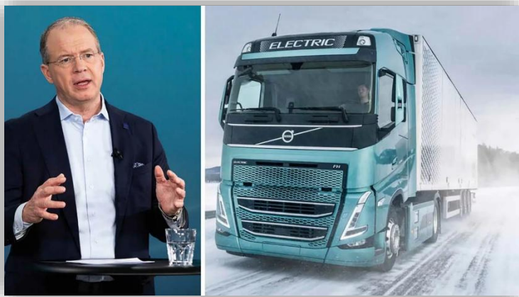
Volvo-chefens nya drömlön: 250 000 kr – om dagen