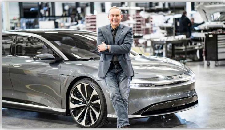
Lucid-chefens sjuka lön: 585 000 kr per bil