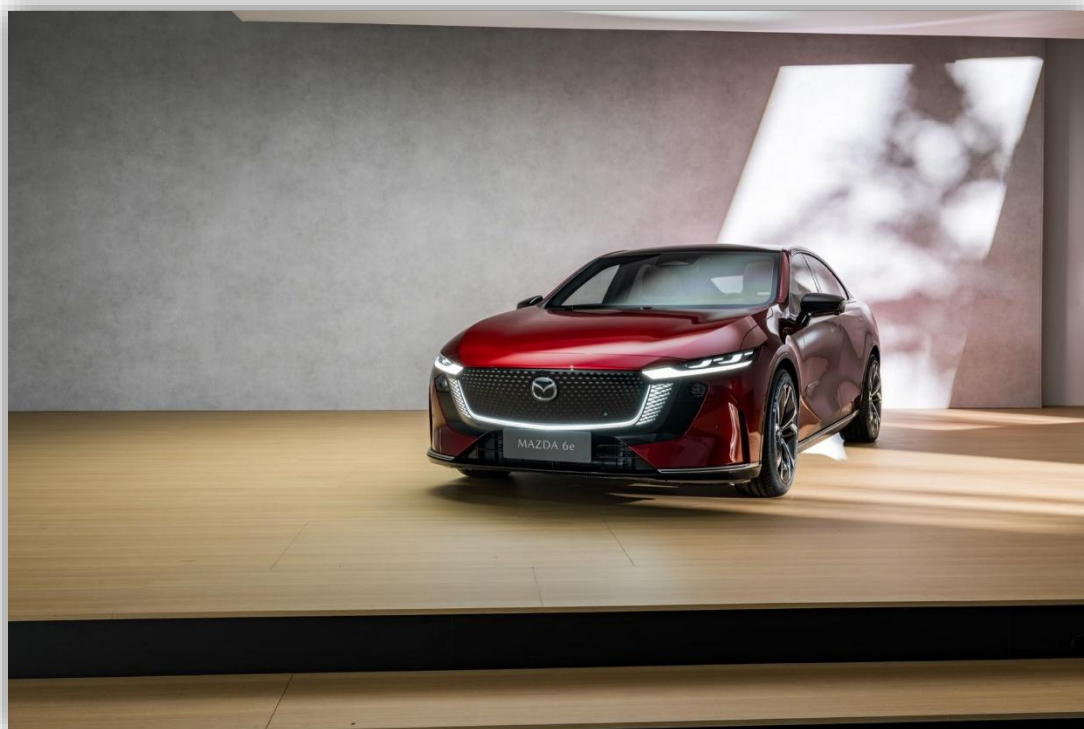
Mazdas nya elbil kommer till Sverige i april Och börjar säljas i sommar