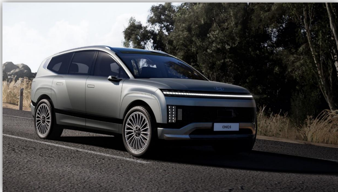
Ioniq 9 och Inster Cross kommer till elbilmässan Stor och liten