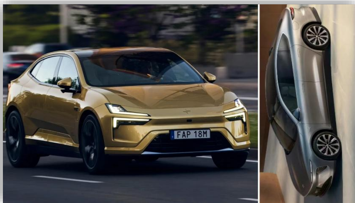
Svensk fond dumpar NIO – ökar stort i Polestar