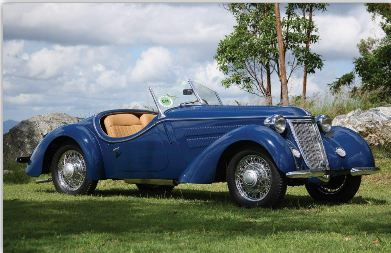
Wanderer W25K Sports 1937