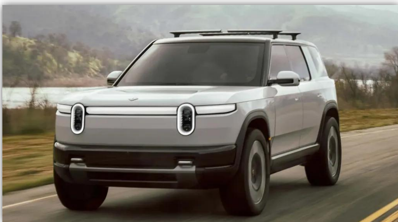
Rivian gör förlust på 12 miljarder på ett kvartal. De hoppas nu att SUV:en R2 ska frälsa dem.