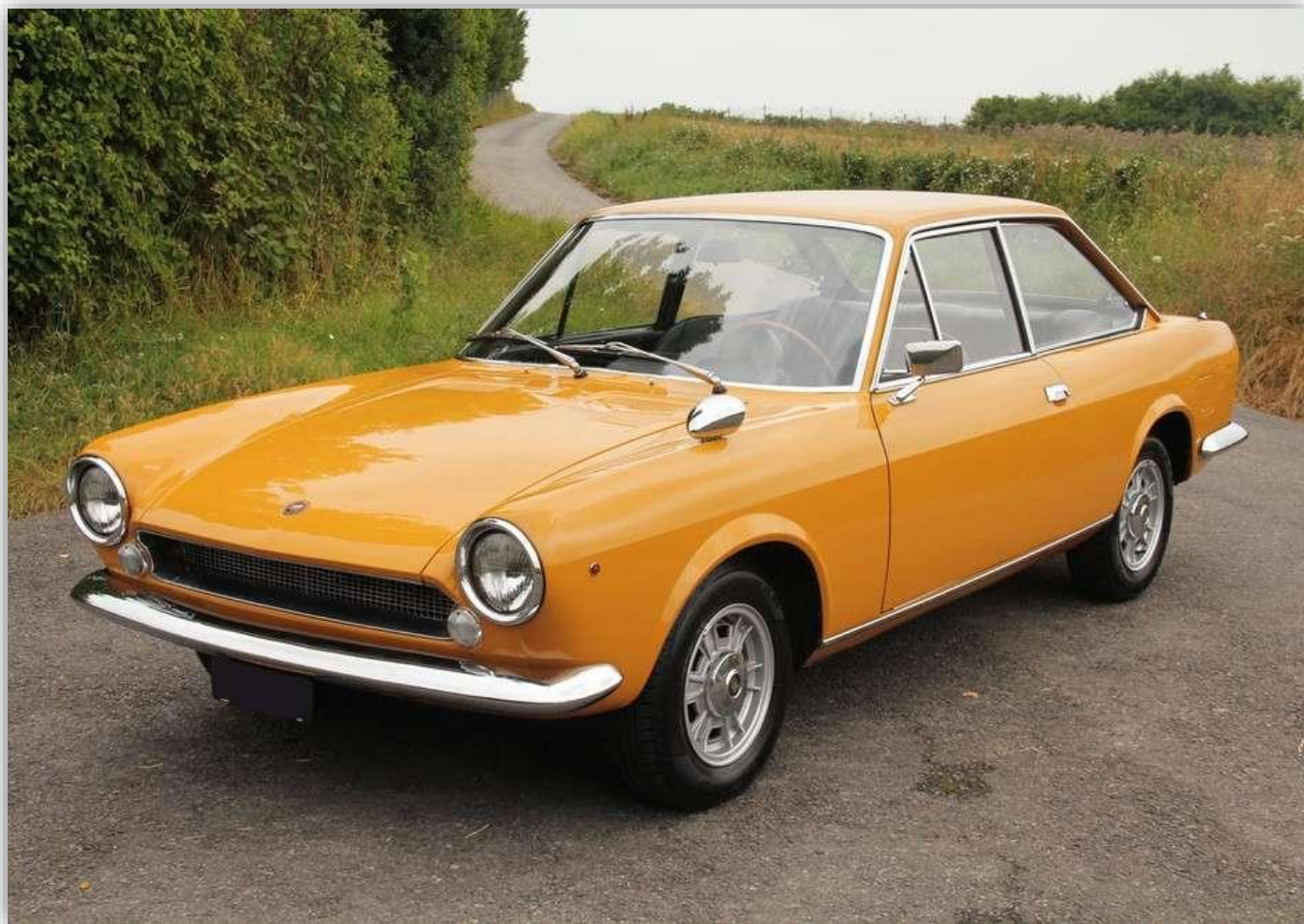
Fiat 124 Coupé 1400 1969