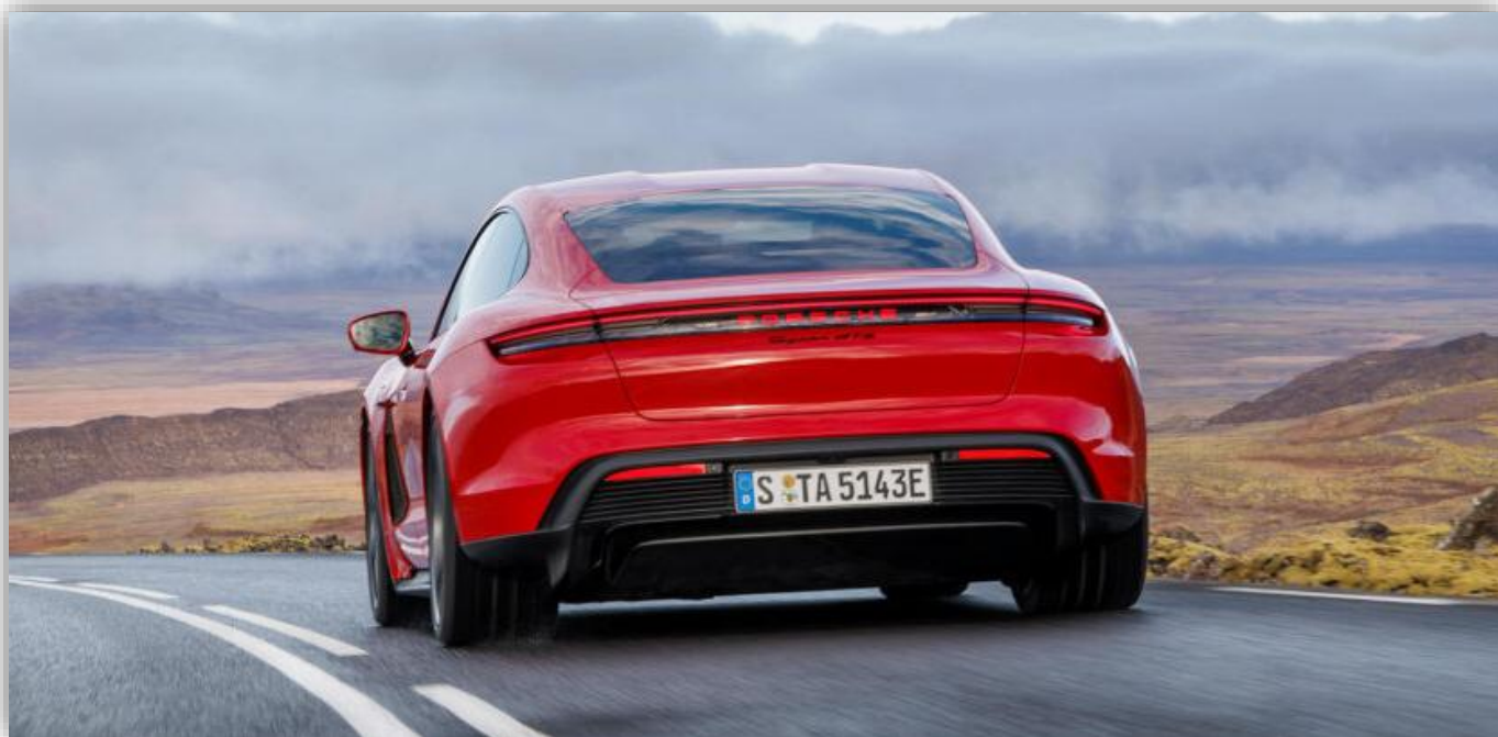
Nytt för GTS-versionen är detaljer i högglanssvart.

Detta om GTS. Tittar vi närmare på Porsche Taycan 4 är det här en sportsedan som beskrivs vara en "fyrhjulsdriven räckviddsmästare".