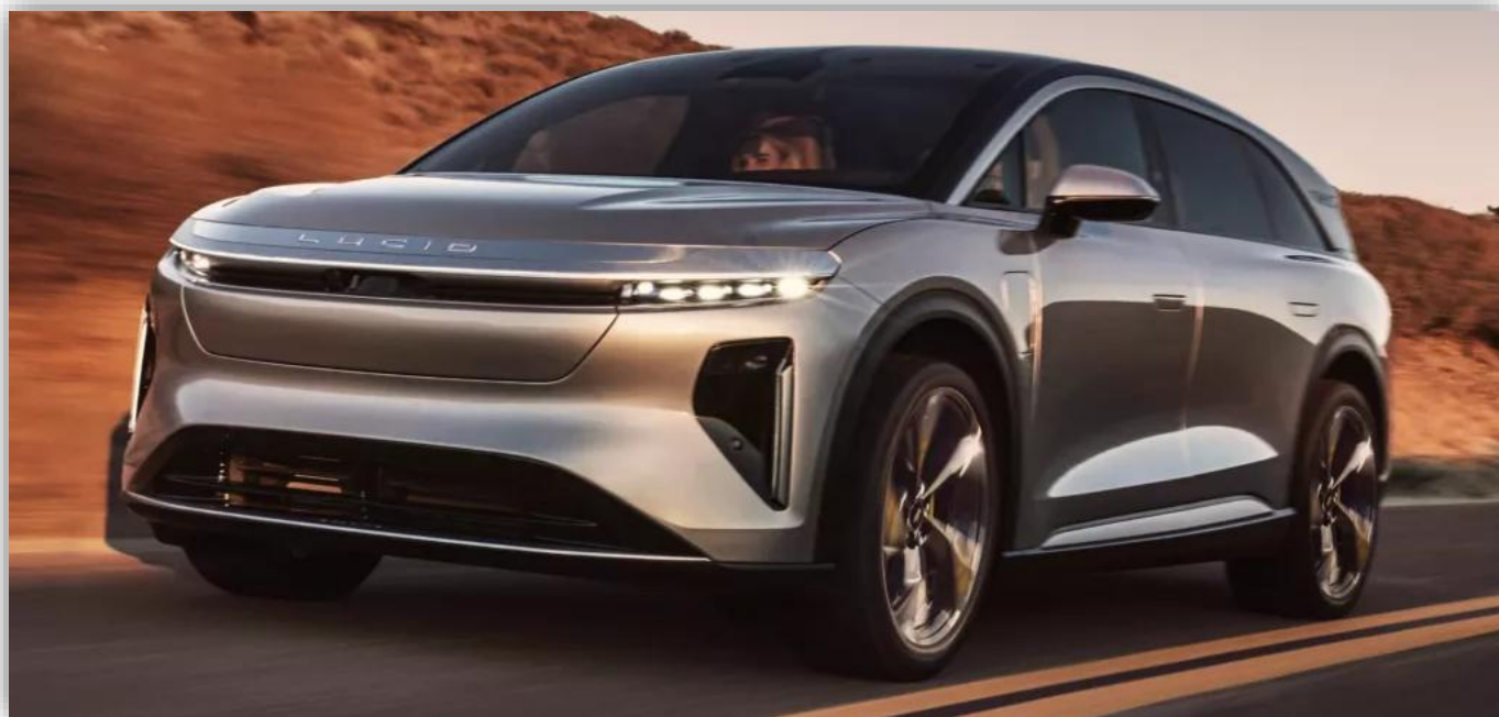
Lucid sätter sitt hopp till nya elektriska SUV:en Gravity.