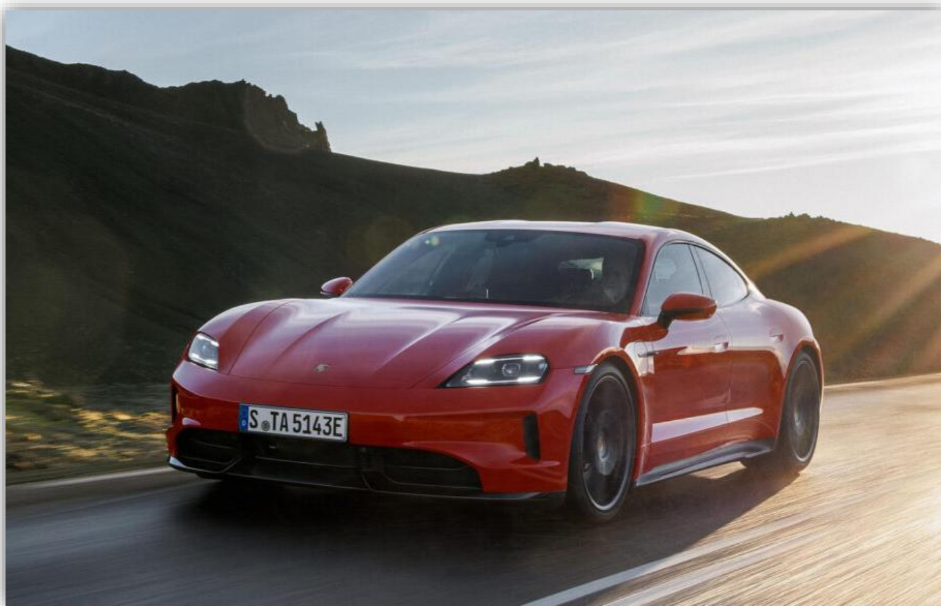
Porsche Taycan GTS i siffror: strömförbrukningen (blandad körning) hamnar på 20,7–18,1 kWh/100 km.