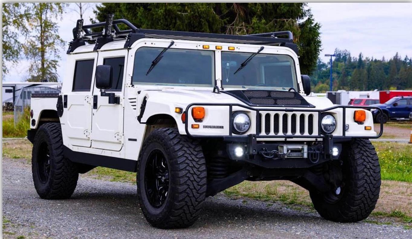
Hummer H1 1994.

Ända sedan Arnold Schwarzenegger fick syn på en HMMVee (Hummer H1) såg han något i den, på samma sätt som alla andra: en ostoppar kraft på tjocka hjul. Och resten är historia.