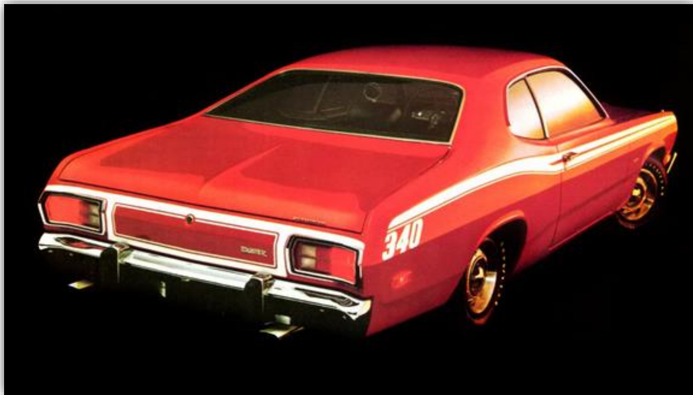
Plymouth Duster i Twisterutförande innebar dekaler på sidorna, 340 kubiktumsmotor och växelväljaren på golvet. Värstingmodellen.

Duster delade de flesta komponenterna med Valiant och Dart, även standardmotorn, den svagt sidolutande raka sexan på 145 hk och 225 kubiktum. En V8 på 318" var lika vanligt motoralternativ på hemmamarknaden och toppmodellen hette Duster 360.