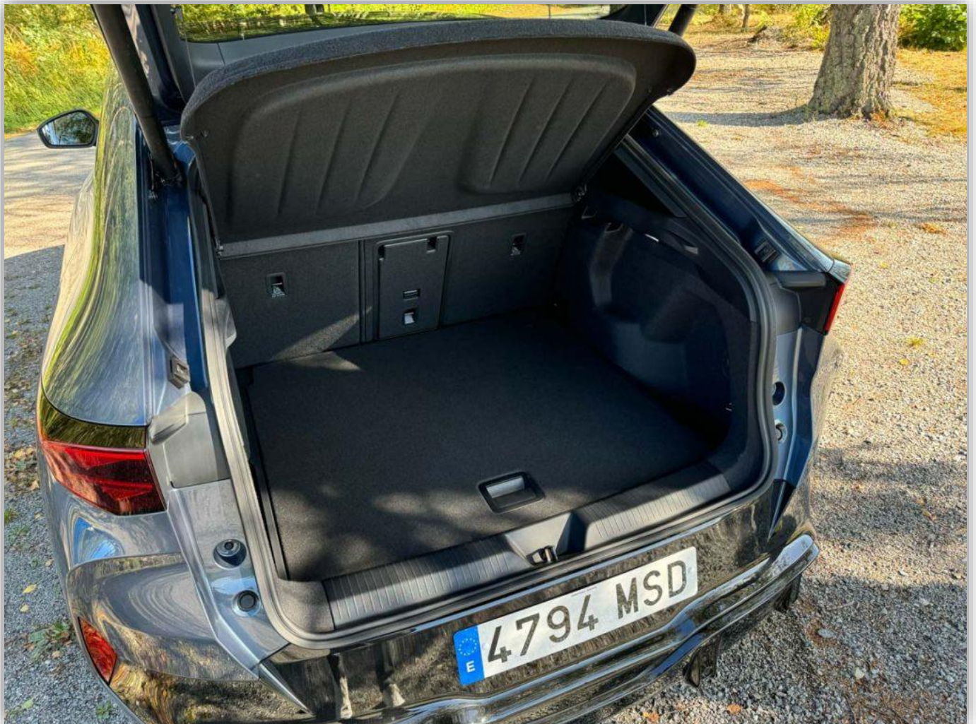
Bagaget är så enkelt, praktiskt – så Volkswagen.

I passagerarutrymmet har Cupra varit betydligt mer modiga och det är som att stiga in i en helt annan värld. Trots att man varit beroende av att använda vissa fasta element som kommer med plattformen som reglage, skärmar och vred så har Cupra satsat allt på att utsmycka det som går att smycka.