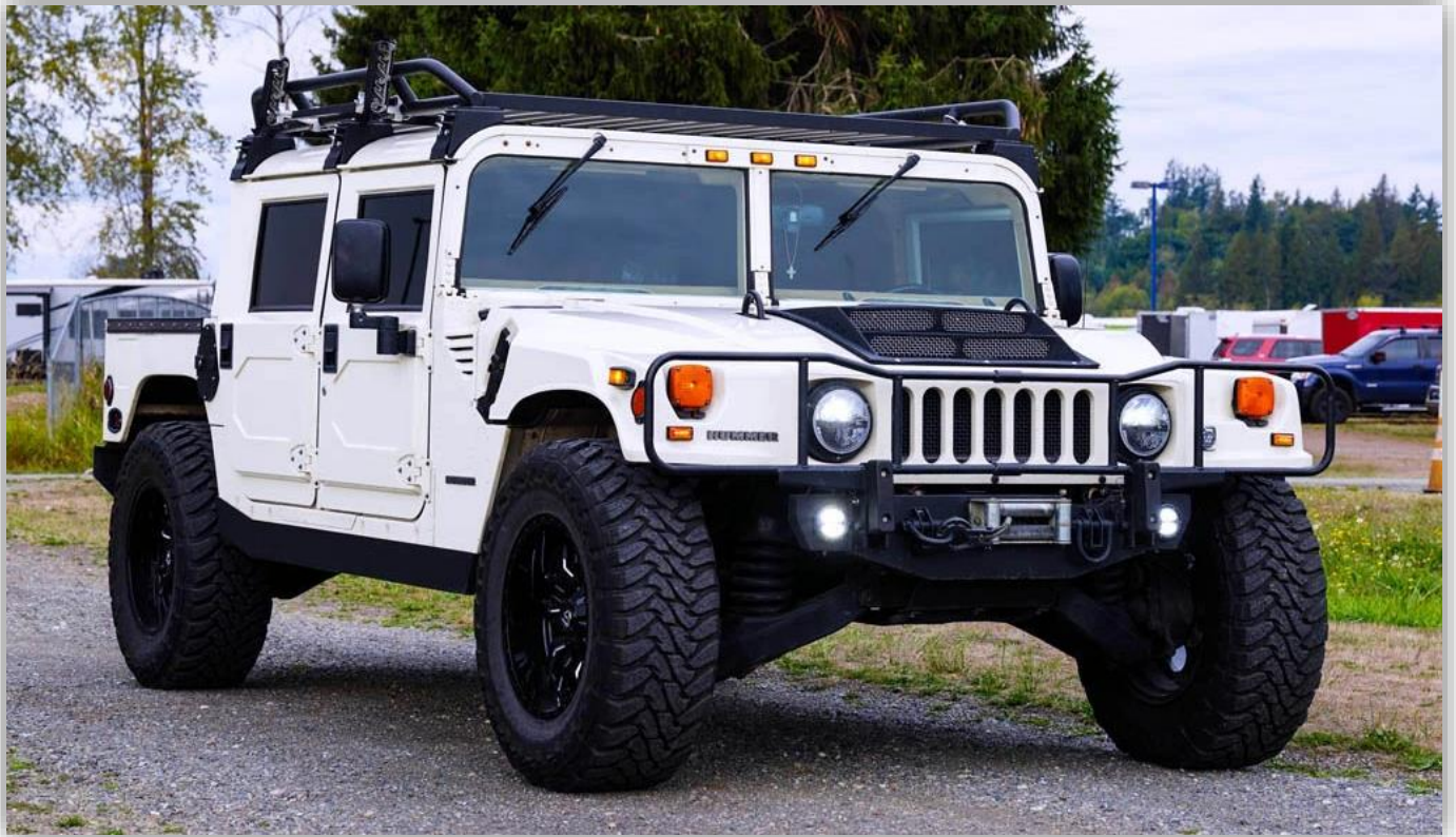
Hummer H1 1994