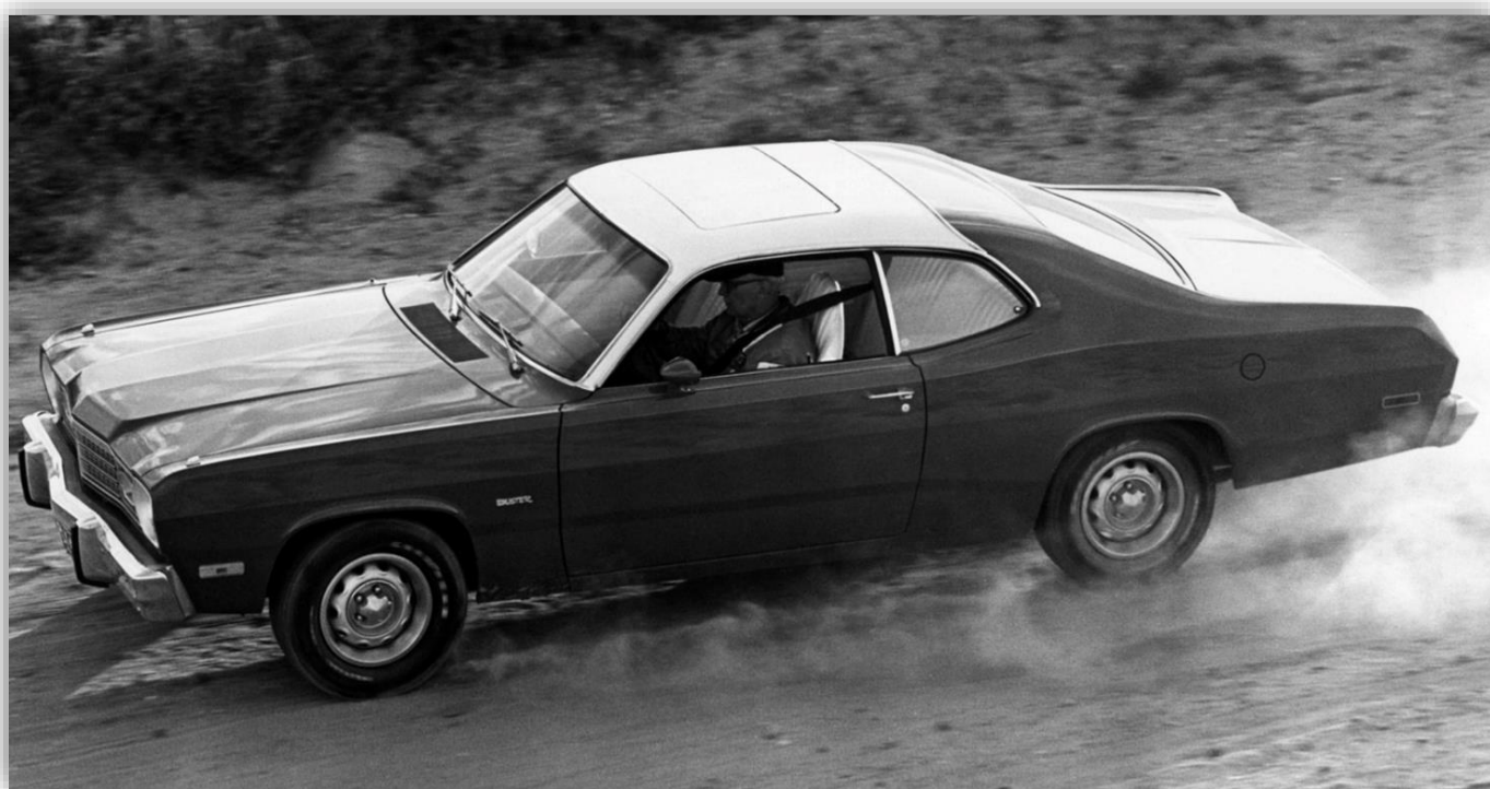
En härligt Duster med sportiga plåtfälgar, så kallade Rallye Wheels.

Duster tillverkades mellan 1970-76, sista året parallellt med efterföljaren Plymouth Volare. Volare fortsatte på samma grundkoncept med samma motorer och andra ärvda mekaniska komponenter.