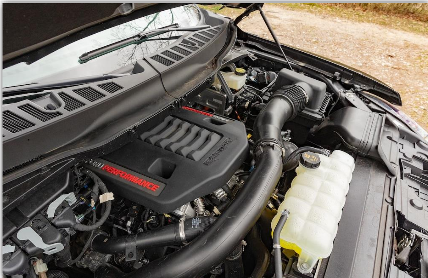
Försvinner nästan in i motorrummet på Ford F-150 Raptor: 3,5-liters V6:an är ovanligt modern.

Interiören är ren amerikansk nonchalans: plastöken, ja, men utförandet är okej. Men vi räknar till totalt 16 (!! ) mugghållaren och mittarmstödet kan omvandlas till ett bord som även rymmer en superstor hamburgermeny. Allt du behöver göra är att placera den automatiska växelväljaren horisontellt, vilket också säkerställer att den här funktionen endast kan användas när den står stilla – smart. Utrymmet fram och bak är överdådigt, känslan av rymd tack vare det dubbla glastaket är himmelsk i ordets rätta bemärkelse.