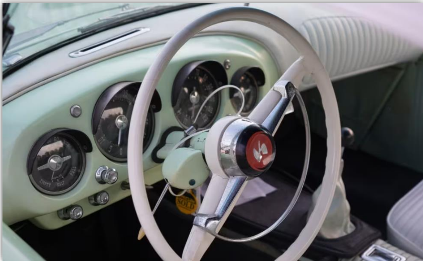
Otroligt stilfull bil denna Kaiser Darrin 1954. Ratten är delikat.