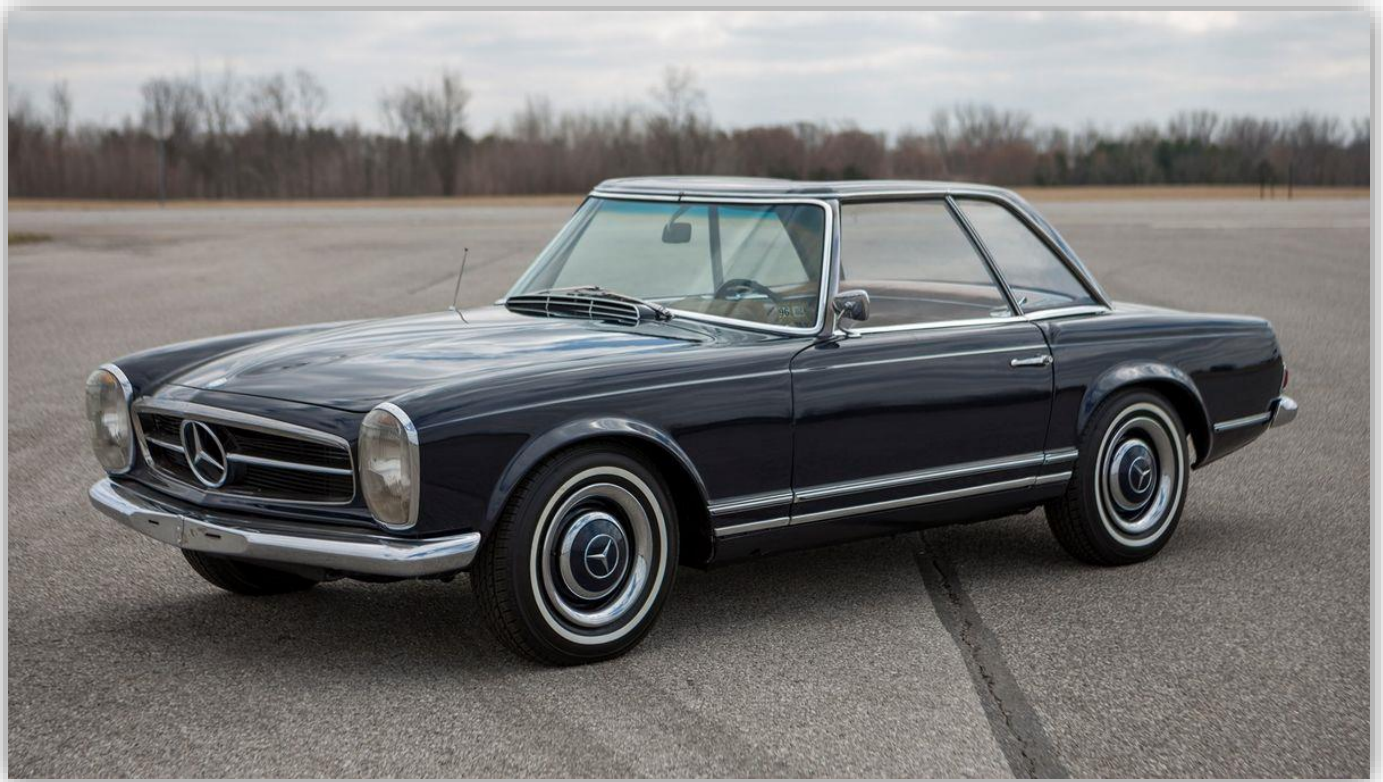
Mercedes-Benz 230 SL "Pagoda" 1964