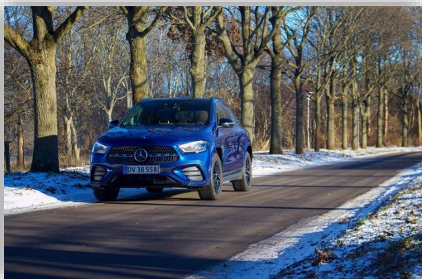
Test: Mercedes-Benz GLA som laddhybrid är vettig för några få