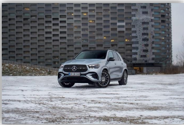
Test: Mercedes-Benz GLE 450 d