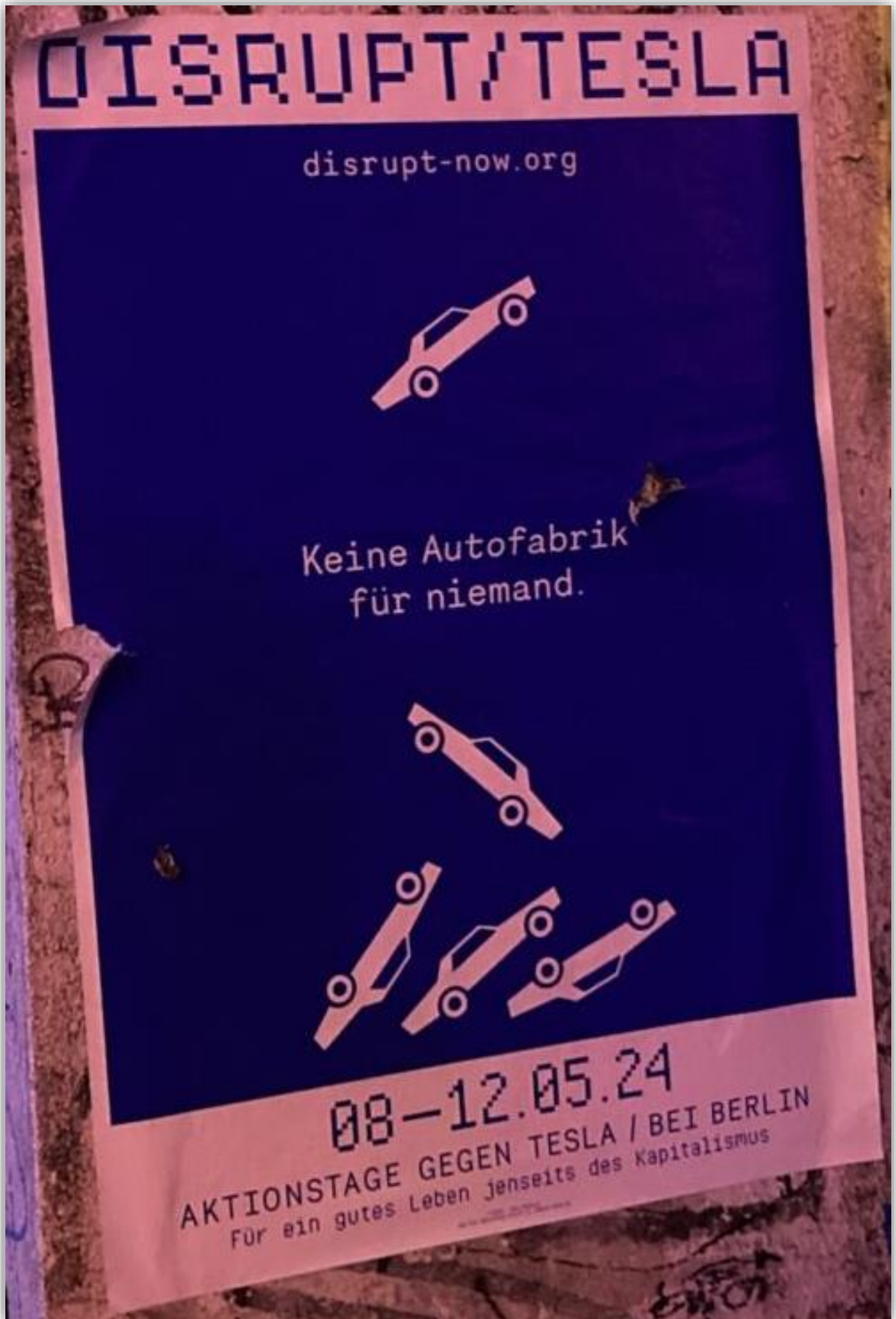
Affisch för aktionshelgen mot Teslas planerade utvidning av fabriken utanför Berlin.