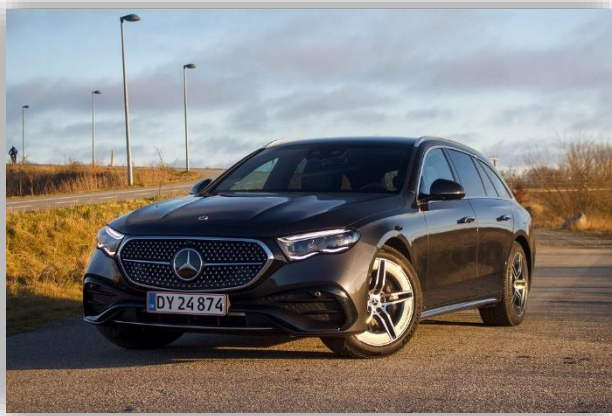
Test: Mercedes-Benz E 300 e är en kraftfull kombi av högsta klass