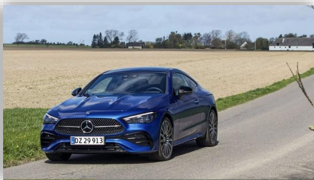
Test: Mercedes-Benz CLE Coupé – en skönhet med kompromisser