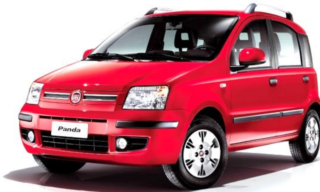
Fiat Panda 30th Anniversary 2010.