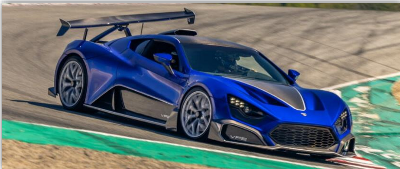
Zenvo Aurora 2025