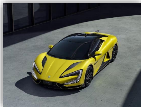
BYD:s nya superbil kan köra med bara tre hjul Och dansa