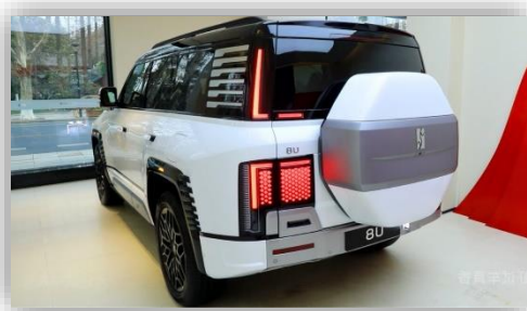
BYDs jätte-suv kanske kommer till Europa Bilen som kan flyta