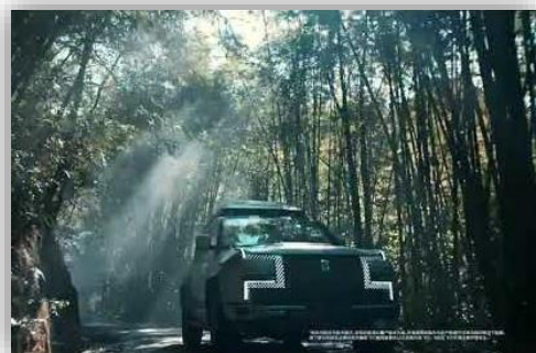
BYD och DJI visar bil med inbyggd drönare Ut på äventyr!