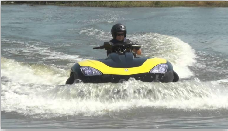
Gibbs Technologies visar upp sina amfibiefordon. Har ett par stycken olika nu.