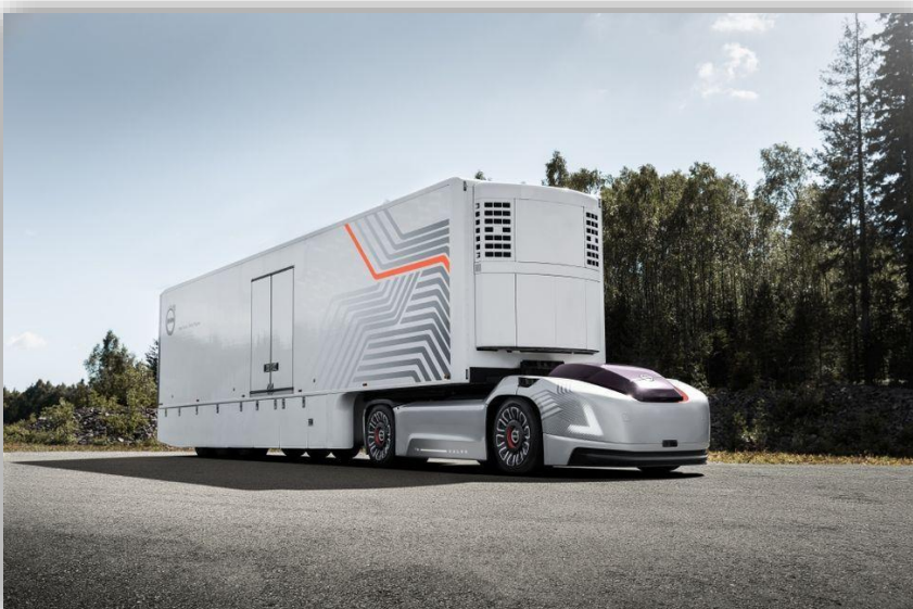
Volvo Vera har fått sin första kund. DFDS ska börja använda självkörande dragare i Göteborg.