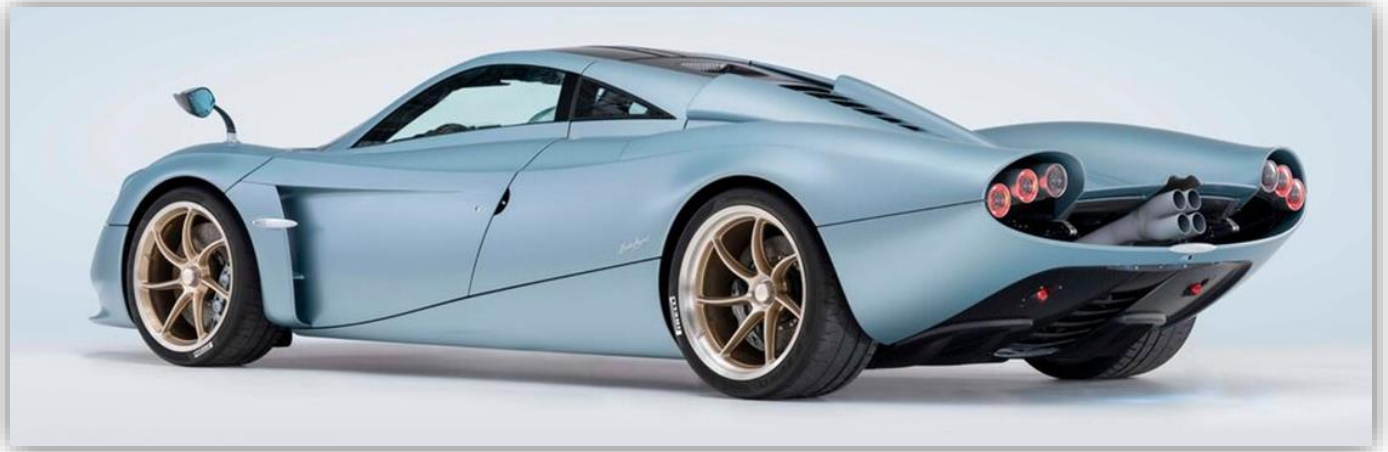
Pagani Huayra Codalunga.