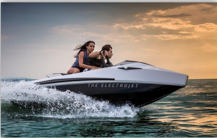
Narke presenterar den eldrivna vattenskotern GT95 Din för 39.000 euro