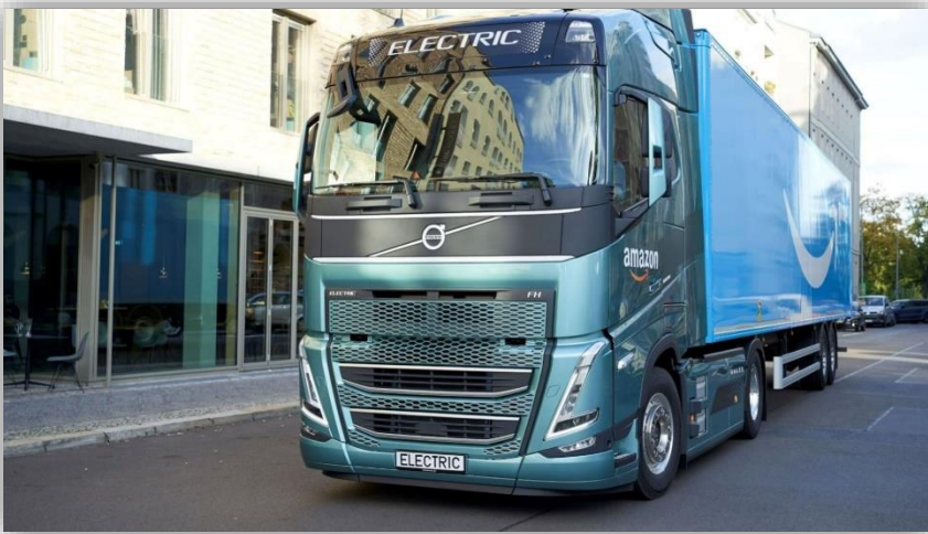
Första eldrivna Volvolastbilarna med fossilfritt stål levererade. Först i världen.