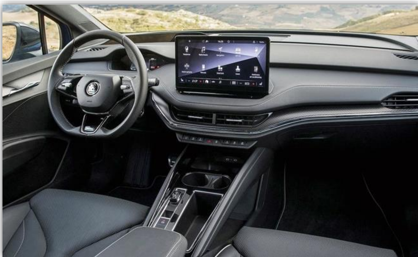
Lagom lyxig och användarvänlig interiör.

Sittkomfort, styrning och chassibalans är andra bidragande orsaker till att man verkligen njuter av att köra Enyaq. Tyvärr var testbilarna inte utrustade med det ställbara chassit DCC. Detta tar annars komforten in i finrummet och man kan åka lyxbilmässigt i el-Skodan. Men även standardchassit bjuder på en behaglig resa.