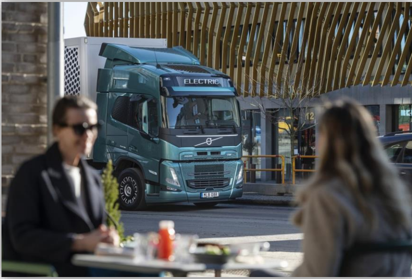
Volvo har sålt 100 tunga ellastbilar. I Sverige.