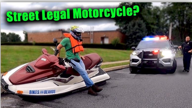
En vattenskotermotorcykelJa, varför inte?