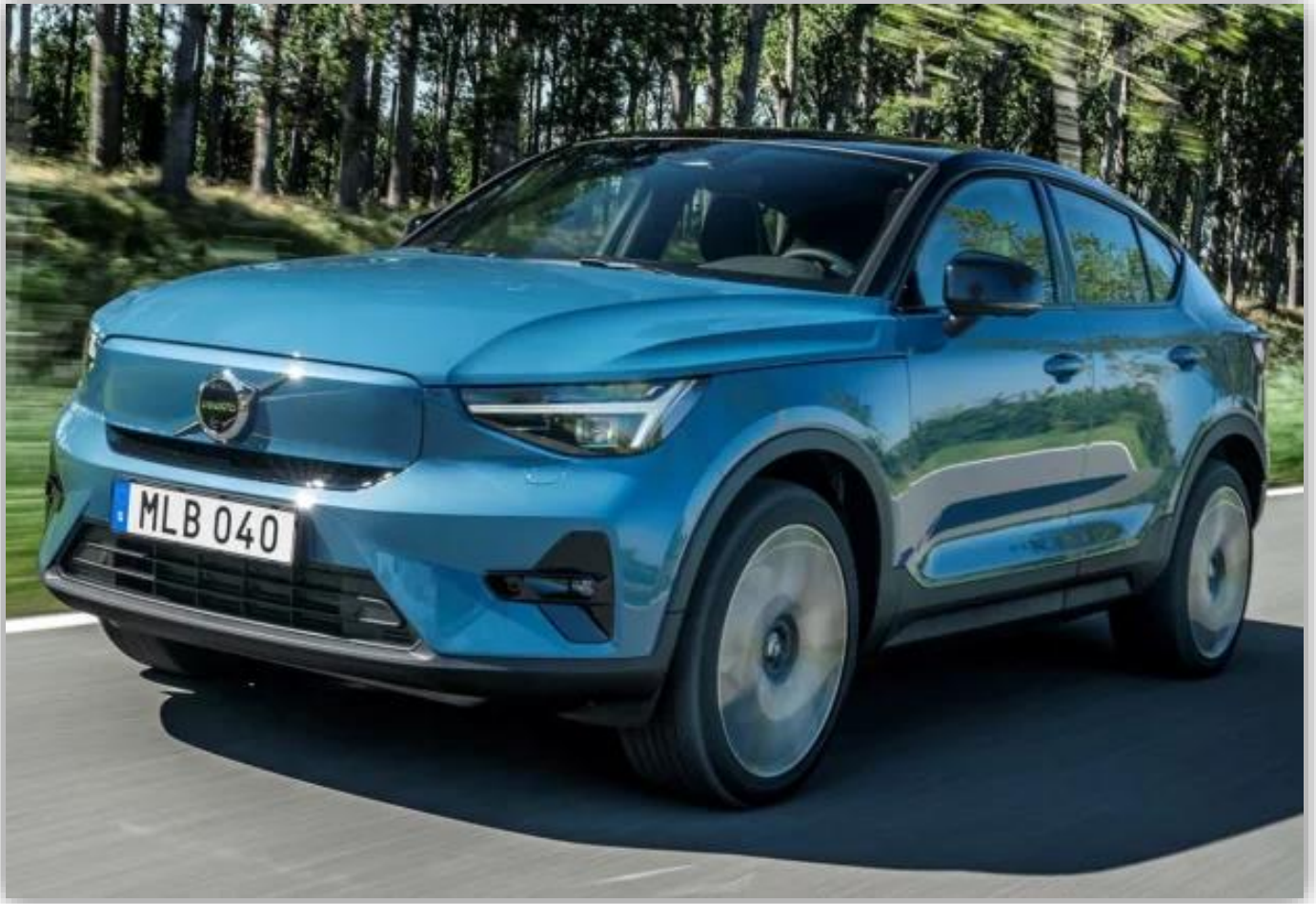
Volvo C40 Recharge.