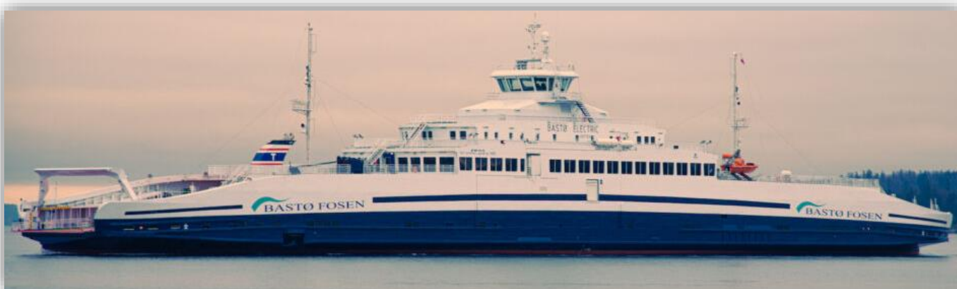
Bastø Electric, eldriven färja i Norge

– Nu tar vi nästa steg och tittar på hur vi kan skapa incitament för att påskynda elektrifieringen av sjöfarten och flyget. En av regeringens prioriteringar är att driva på den gröna industriella revolutionen med investeringar i hela landet. Så minskas utsläppen och så hamnar framtidens jobb i Sverige, säger infrastrukturminister Tomas Eneroth i ett uttalande.