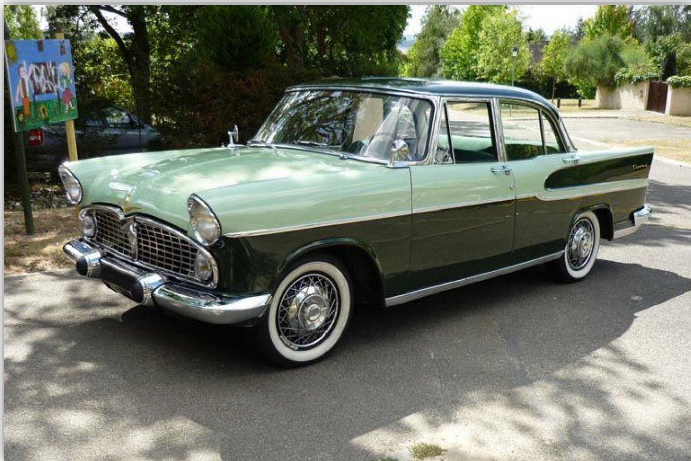
Simca Vedette 1955 – 1961.