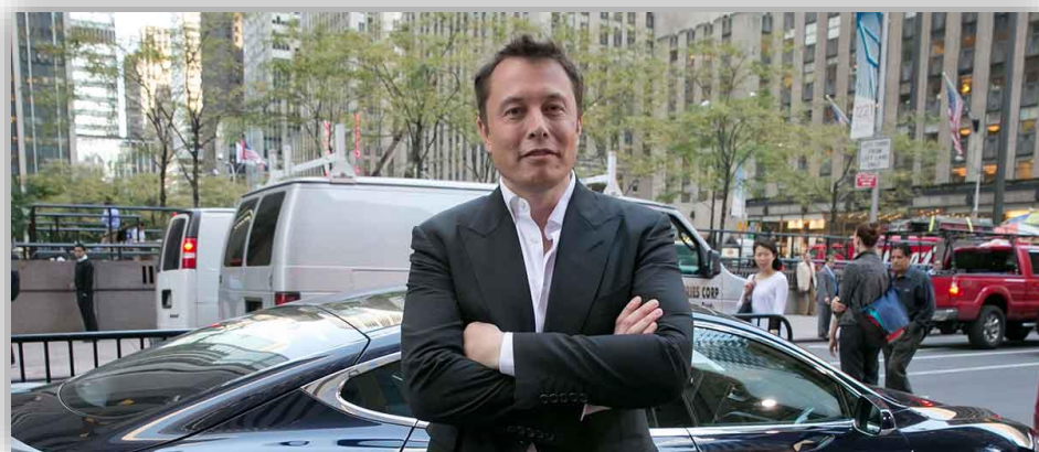
Elon Musk sätter världsrekord i skatt.

Elon Musk betalar motsvarande 100 miljarder kronor i skatt under 2021 vilket är mest någonsin, meddelar Tesla- och SpaceX- vd:n själv på twitter.