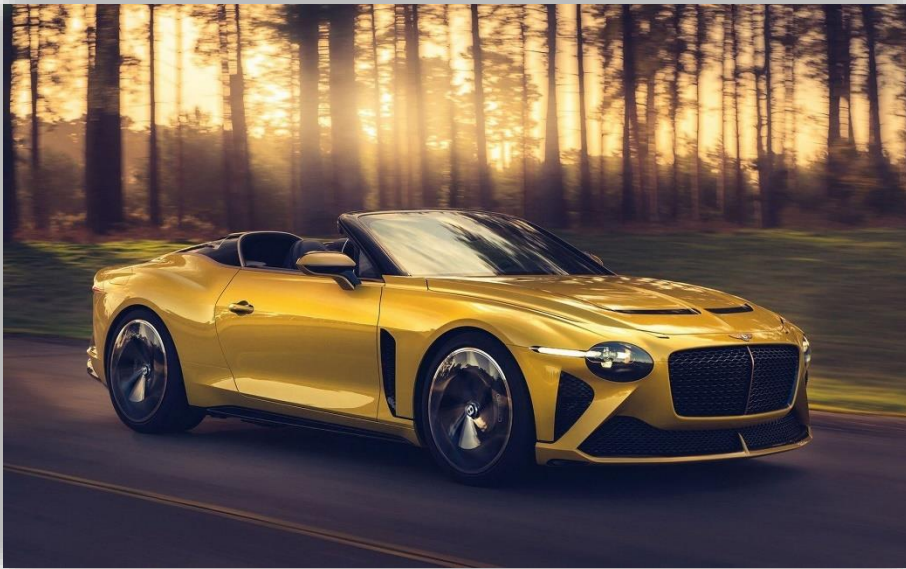
Bentley Mulliner rullar ut Bacalar. En Continental GT för två.