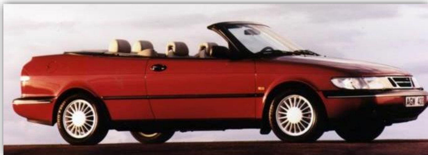
SAAB cabriolet, 1996.

Konkursförvaltarna efter Saab Automobiles konkurs har i dag – efter tio år – lämnat in slutredovisning och slututdelningsförslag till Vänersborgs tingsrätt. Oprioriterade fordringsägare från konkursen föreslås få cirka 11 procents utdelning på sina fordringar.