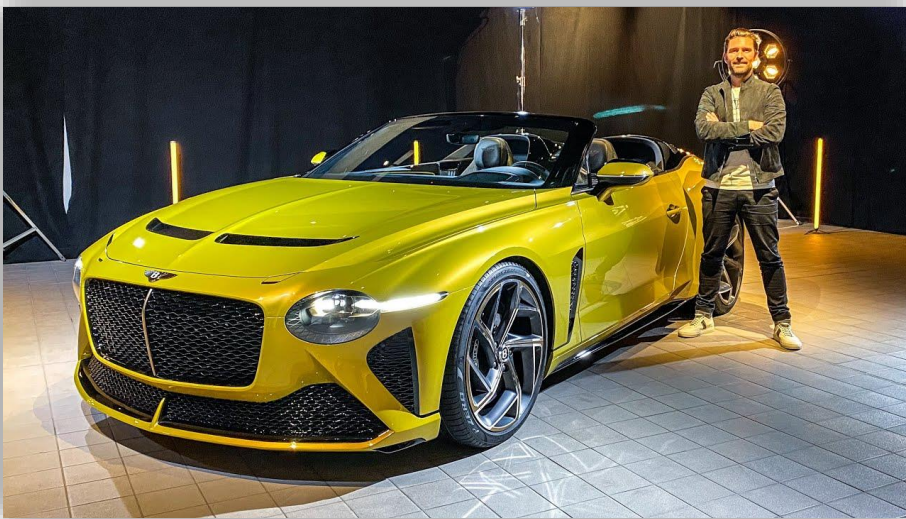
Mr JWW spanar in Bentley Mulliner Bacalar. Lyx och överflöd för två.