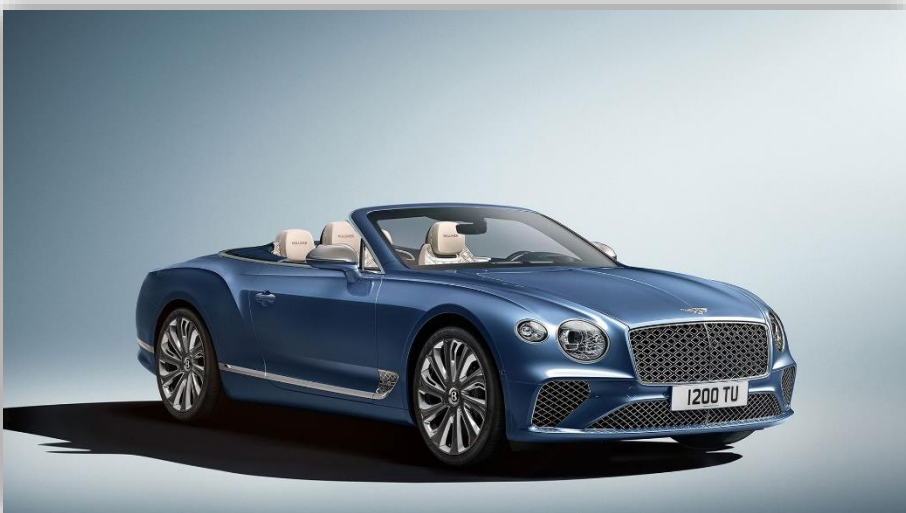
Det här är Mulliners nya Bentley Continental GT cabriolet. Lyxar till lyxbilen ytterligare.