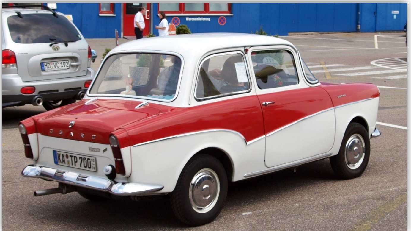
1960-moderniseringen såg bakljusen förstöras och den bakre stötfångaren nu (valfritt) förkromad - omformad för att tillgodose denna förändring.

Dessvärre stod inte allt rätt till med pengaflödet. Visserligen hade firman byggt drygt 40 000 bilar i 1004–1304-serien, men 1700-modellen hade kostat en hel del att utveckla. Det hade märkets kanske allra vackraste modell också gjort. Den kallades först 1300 GT och senare med större motor 1700 GT.