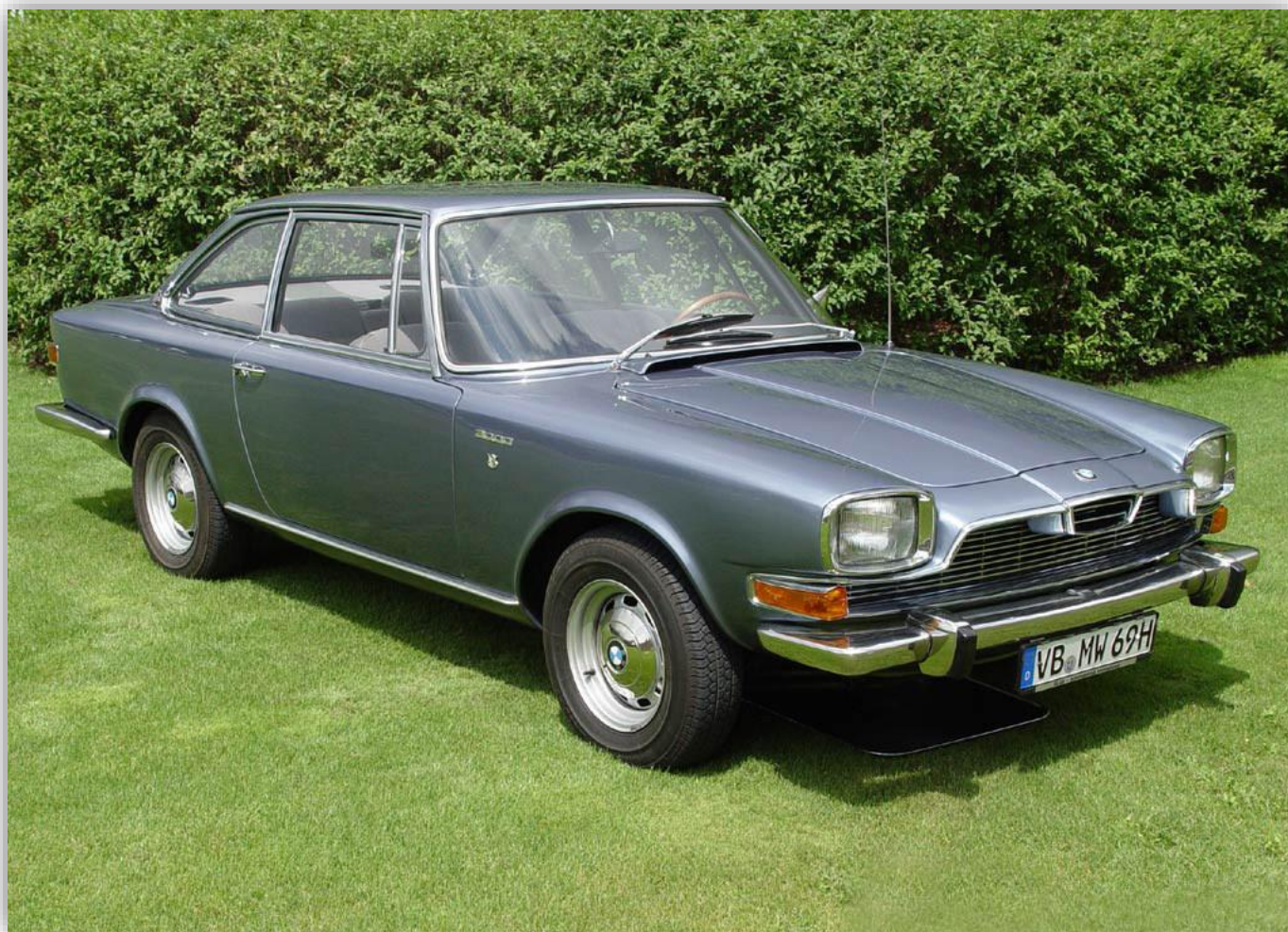
BMW Glas 3000 1967–68.

Tre månader senare tog BMW över rulljansen och produktionen lades ner i början av 1967. Men mellan september 1967 och maj 1968 byggdes bilen igen, nu med trelitersmotor och BMW-emblem, onekligen ett erkännande.