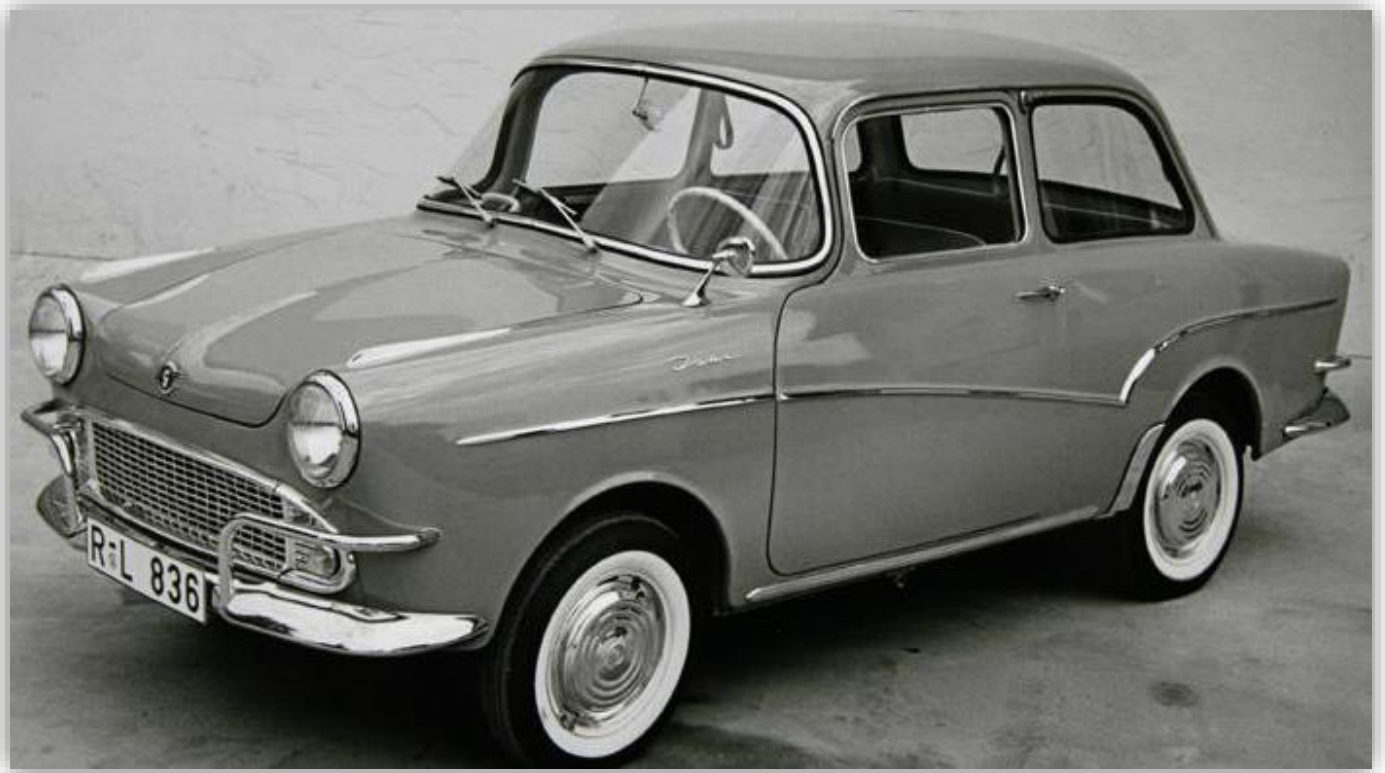
1961 års Glas Isar-Limousine var ganska lik en Trabant men hade fyrtaktsmotor av boxertyp, monterad fram men drivningen låg på bakhjulen.

Dessvärre stod inte allt rätt till med pengaflödet. Visserligen hade firman byggt drygt 40 000 bilar i 1004–1304-serien, men 1700-modellen hade kostat en hel del att utveckla. Det hade märkets kanske allra vackraste modell också gjort. Den kallades först 1300 GT och senare med större motor 1700 GT.