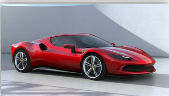
Ferrari 296 GTB – V6 hybrid med 830 hästkrafter.