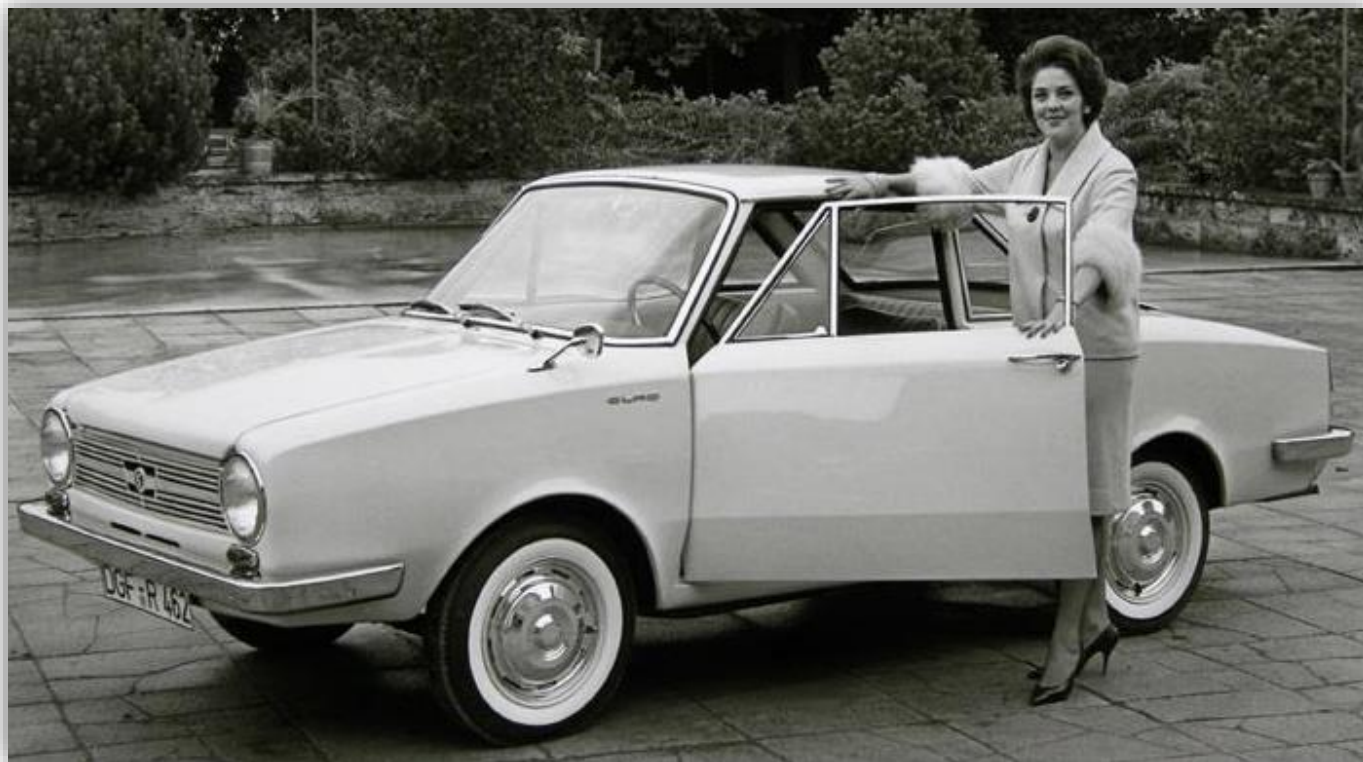
Flott värre med italienskritad kaross! Glas Coupé S 1004 tillverkades 1962 och 63. De 42 hästarna gav en toppfart på 135 knutar.

Även här hade Frua ritat karossen, en snygg liten coupé, som började byggas i mars 1964. Det var för övrigt Frua som också byggde karosserna. Totalt blev det 5 378 exemplar. De sista av dem tillverkades sedan BMW 1966 räddat firma Glas undan total bankrutt.