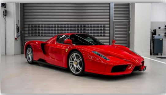
Formel 1-stjärnan säljer fem av sina Ferraris.