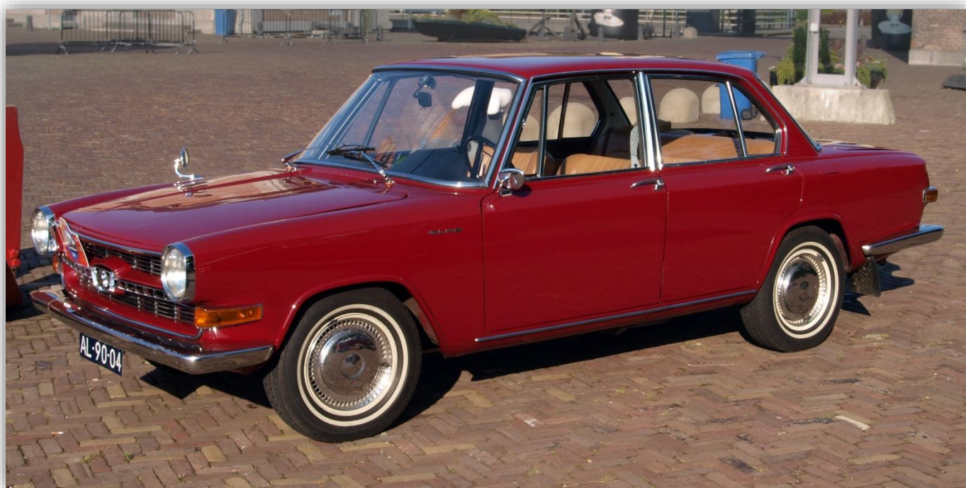
Glas 1700 var firmans första mellanklassbil, i storlek och proportioner ganska lik konkurrenten BMW 1800. 13 789 såna här vagnar tillverkades, men har du sett någon?

Namnet Glas 1700 GT fick faktiskt leva ett år till men sedan var det dags att byta namn till BMW 1600 GT. Motor, växellåda och bakaxel kom nu från BMW 1600 TI. Bara 1 255 sådana vagnar byggdes, riktiga rariteter alltså.