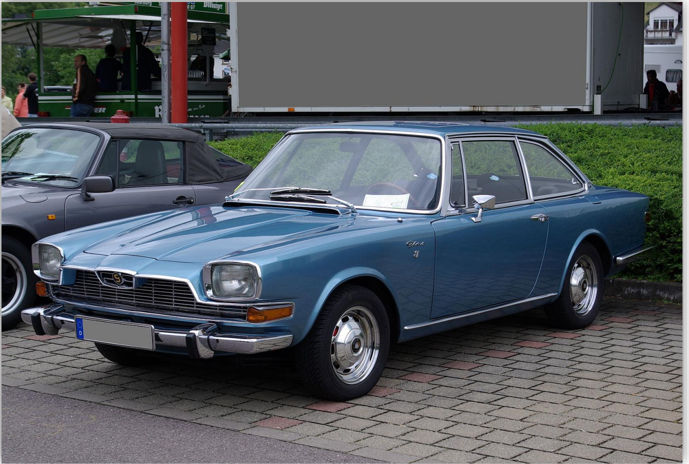
"Glaserati" blev smeknamnet på firmans mest kraftfulla vagn, med 2,6-liters V8-motor på 150 hk. Såldes senare som (BMW) Glas 3000 V8 men var då bara tio hästar starkare.