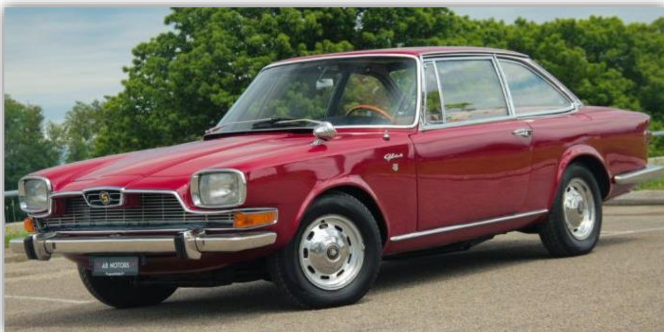
Glas 2600 V8 1967

I likhet med åtskilliga andra bilbyggare startade Hans Glas GmbH sin verksamhet med att tillverka jordbruksredskap. Detta hände sig i staden Dingolfing i tyska Niederbayern. Firman grundades redan vid 1800-talets mitt och blev mycket framgångsrik. Trots det dröjde det ända till 1951 innan företaget gav sig in på området motordrivna fordon.