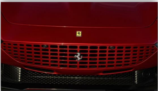
Ferrari bekräftar kommande elbil.