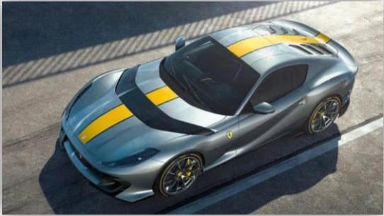
Första detaljerna – ännu snabbare Ferrari 812 Superfast.