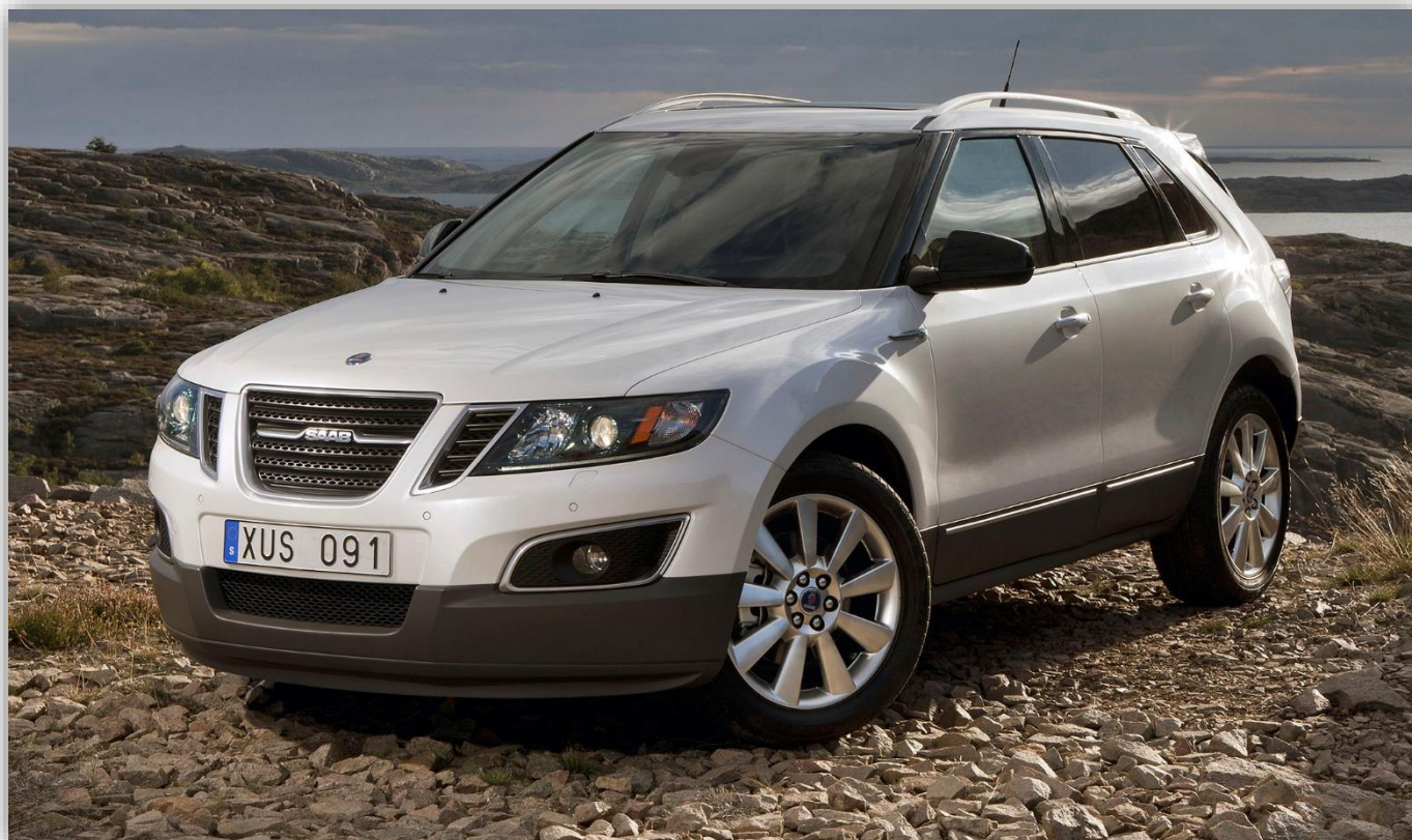
Saab 9-4X 2011.