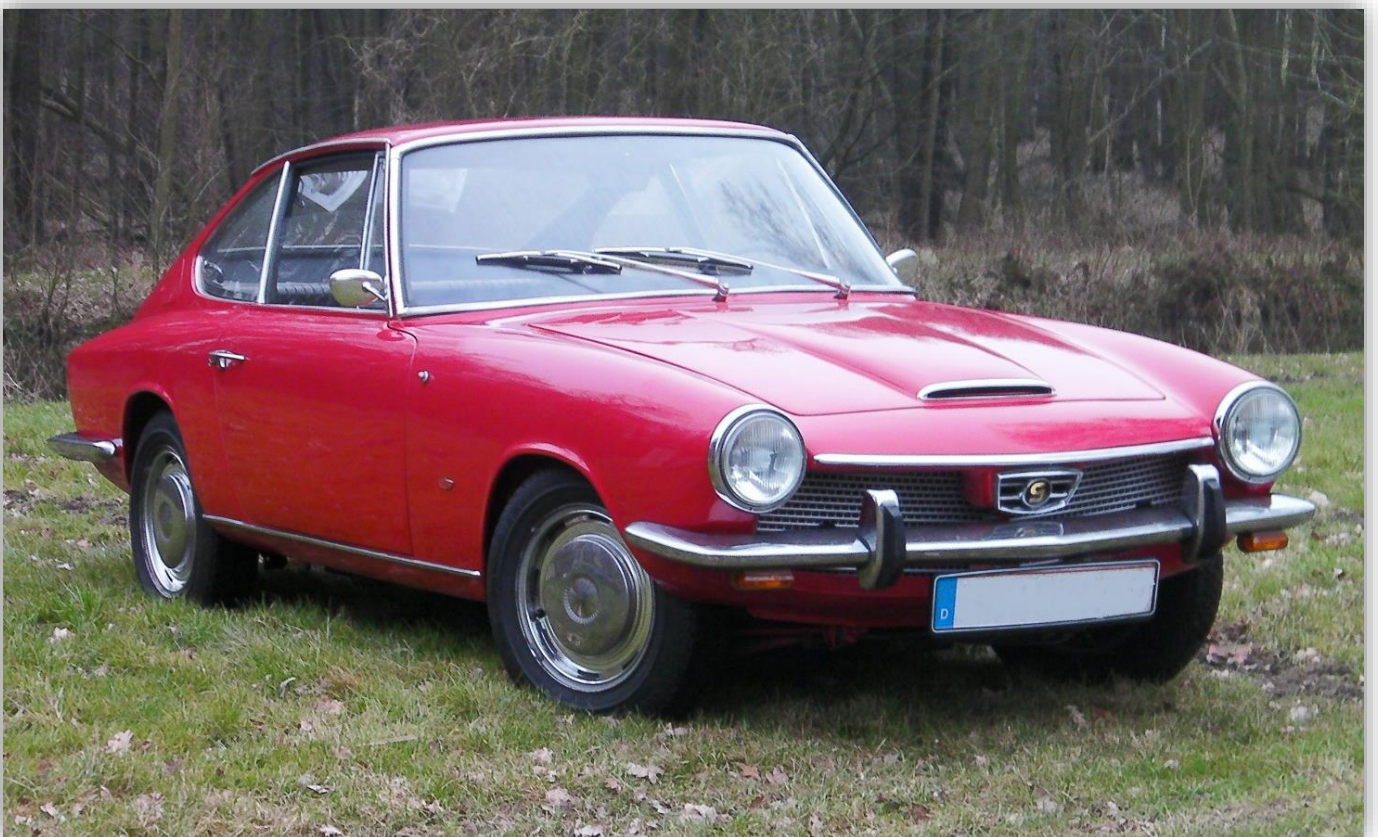
Den lilla sportcoupén från Glas hade först 1 300-kubiksmotor och senare en 1 700. Kallades mot slutet BMW 1600 GT.