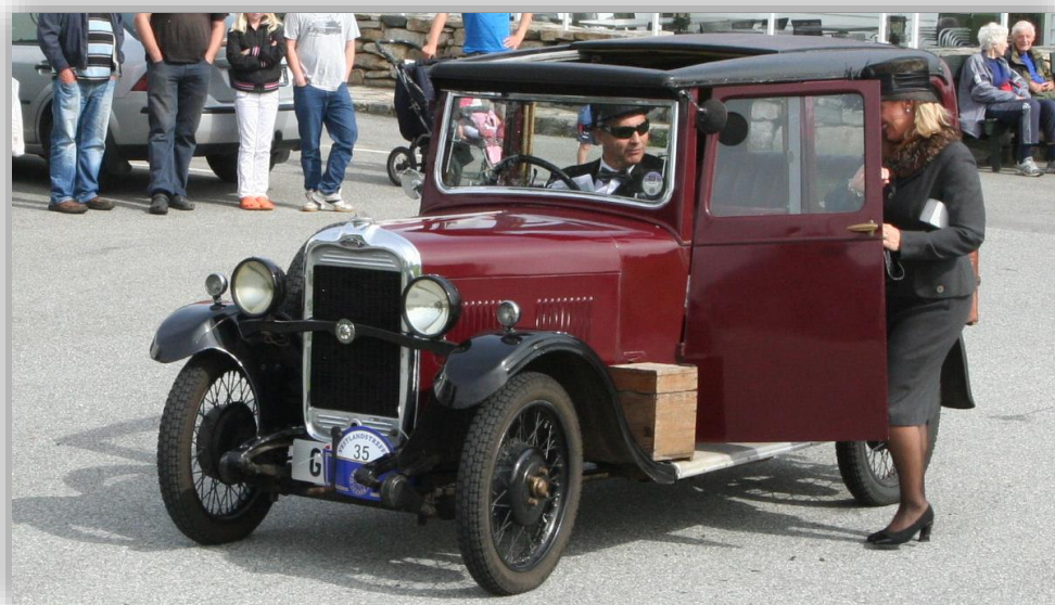
Singer Junior Saloon 8 HP 1931.

Enstaka 10- och 20-talsbilar har förmodligen funnits här i landet, men nu är det tveksamt om någon finns kvar. Ändå var Singer ett stort märke på hemmaplan, faktiskt trea i den engelska försäljningen, efter Austin och Morris, i slutet av 20-talet.