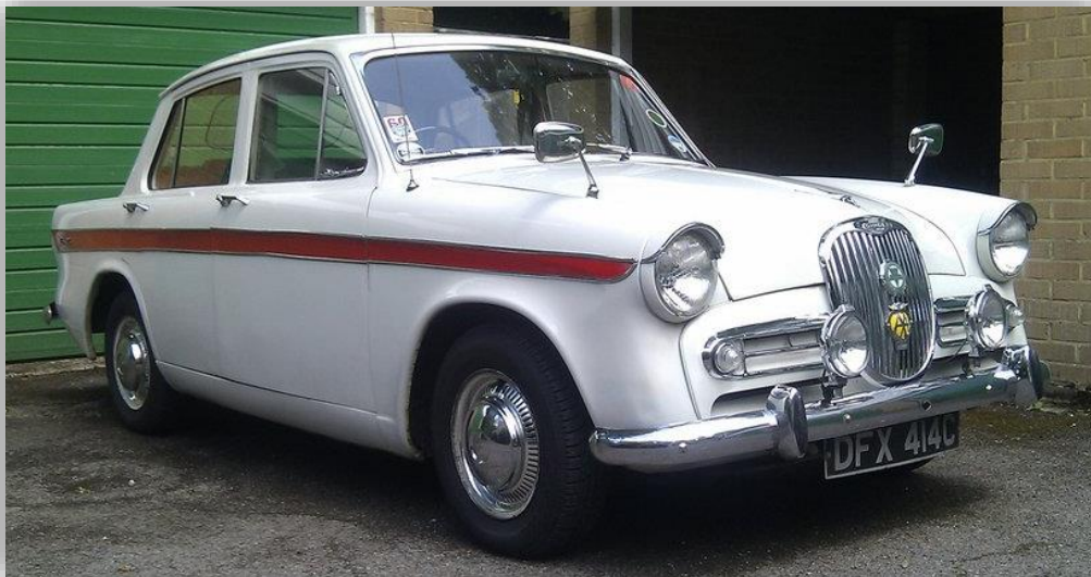
Singer Vogue var en glorifierad Hillman Super Minx. Byggdes i detta utförande åren 1961–64 i nästan 30 000 exemplar.

Hos Hillman hette de här bilarna Minx och hos syskonet Sunbeam kallades de Rapier. Här prövades verkligen kundernas märkeslojalitet! Skulle de köpa en Singer som var en onödigt dyr Hillman?