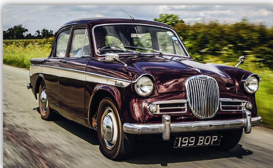
Singer Gazelle 1956 - 1970.

Åren innan engelska Singer år 1905 började med riktig bilproduktion hade firman byggt trehjulingar och motorcyklar, och dessa i sin tur var sprungna ur en lönsam trampcykel-tillverkning.