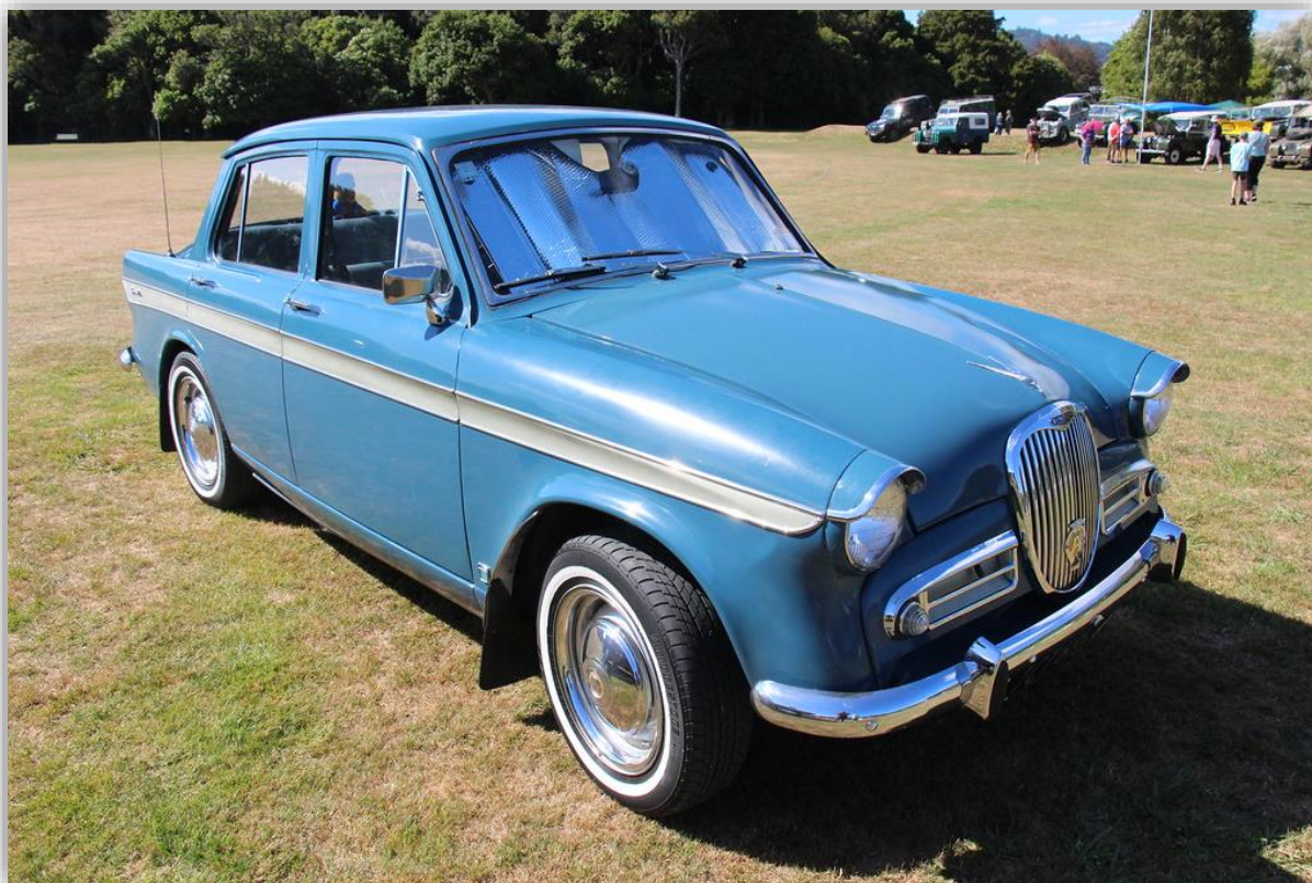
1963–65 såldes 20 000 Gazelle V. Bland nyheterna: skivbromsar fram och vassare former på taket.

Fast en sorts undergång blev det trots allt, ty från och med nu var Singer-bilarna i själva verket uppsnofsade Hillman-modeller. Den första av dem kallades Gazelle och fanns att köpa som saloon, stationsvagn och cabriolet.