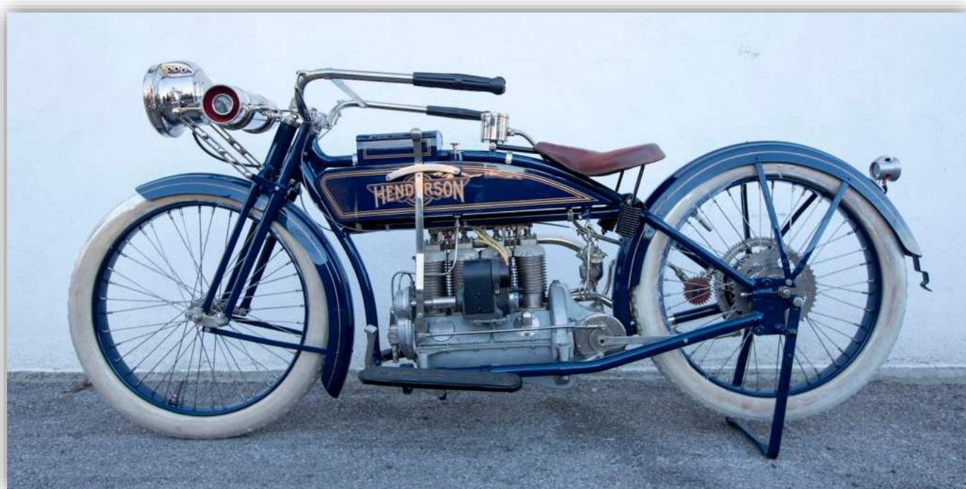
En Henderson Four från 1916 var sin tids mest avancerade motorcykel.

Excelsior-Henderson är ett av världens mest klassiska motorcykelmärken. Ett märke som har lyckats hänga kvar i minnet trots lång frånvaro och även har nyttillverkats i omgångar. Nu har indiska Bajaj köpt märkets IP-rättigheter när det kommer till kläder och tillbehör. Alltså "International Property Rights". Rätten till att använda namnet på motorcyklar förvärvade Bajaj redan för två år sedan.