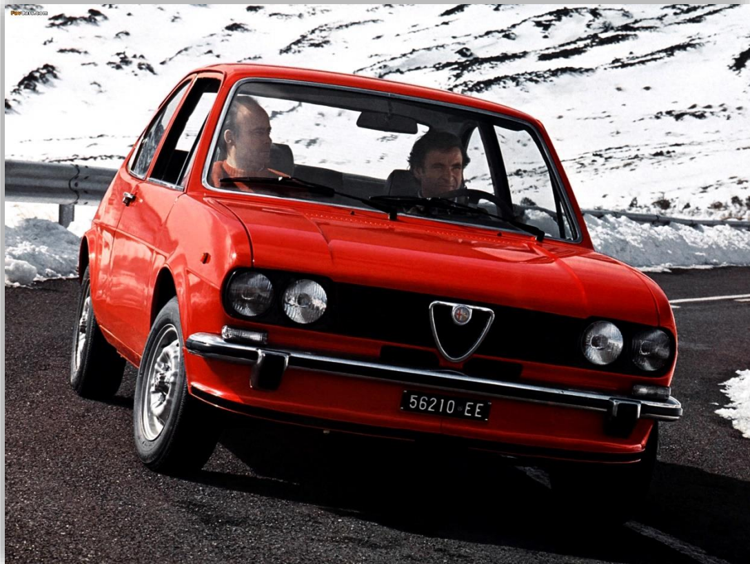
Alfasud TI med lite starkare motor och dubbla strålkastare kompletterad programmet efter en tid.

Såväl motorpress som de första köparna förbluffades över hur exakt och rolig Sud var på vägen och att motorn trots endast 1,2 liters cylindervolym var så pigg. Kupén var rymlig med bättre benutrymme i baksätet än i många fullstora bilar och det lådformade bagageutrymmet svalde förvånande mycket, bara pinalerna kunde träcklas in genom den lilla luckan.