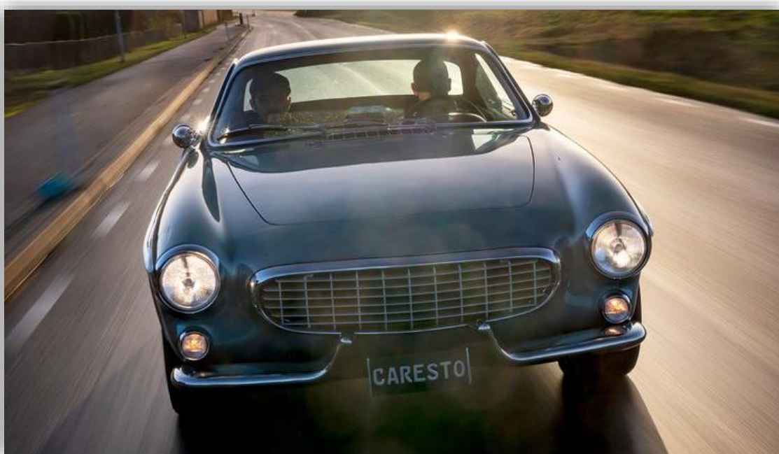
Caresto P1800 GTe – klassiker med (dubbla) elmotorer.