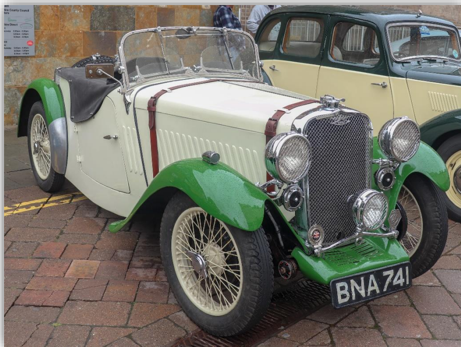
Singer Nine Sports 1933.