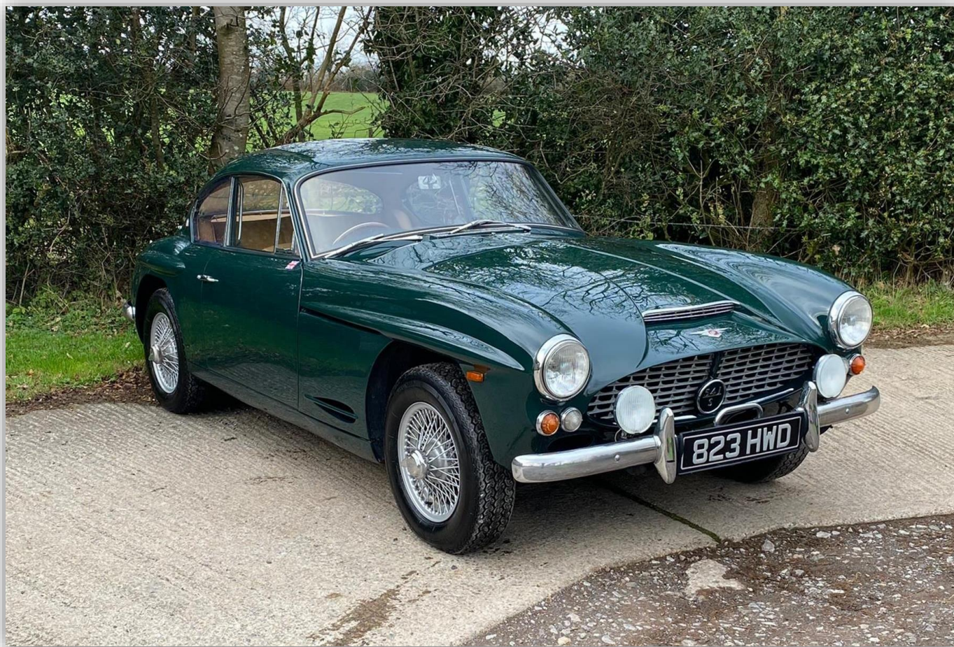
Jensen CV8 (Mk1) 1962–63.