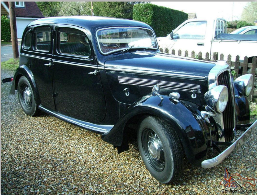
1947 lanserades åter Singer Super-Twelve, en bil som också byggts före kriget. Välbyggd men ingen storsäljare. Bara 1 098 ex tillverkades.