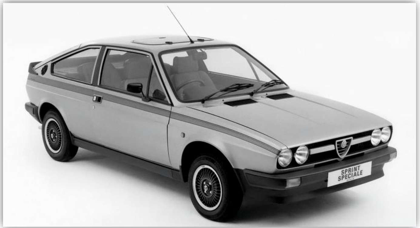
Alfa Romeo Alfasud Sprint 1.5 Speciale 902 (1983).