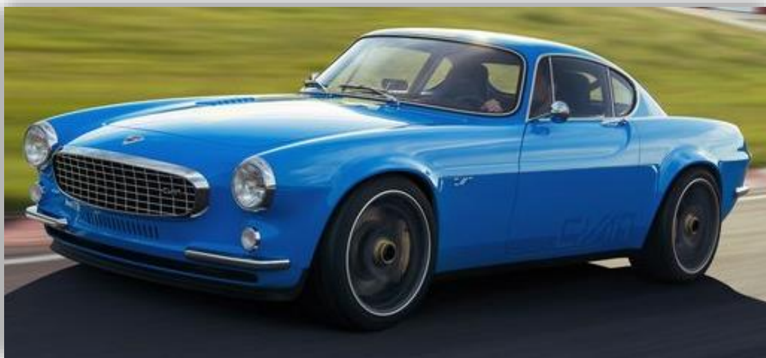
Legendariska Volvo P1800 är tillbaka – här är Volvo P1800 Cyan.