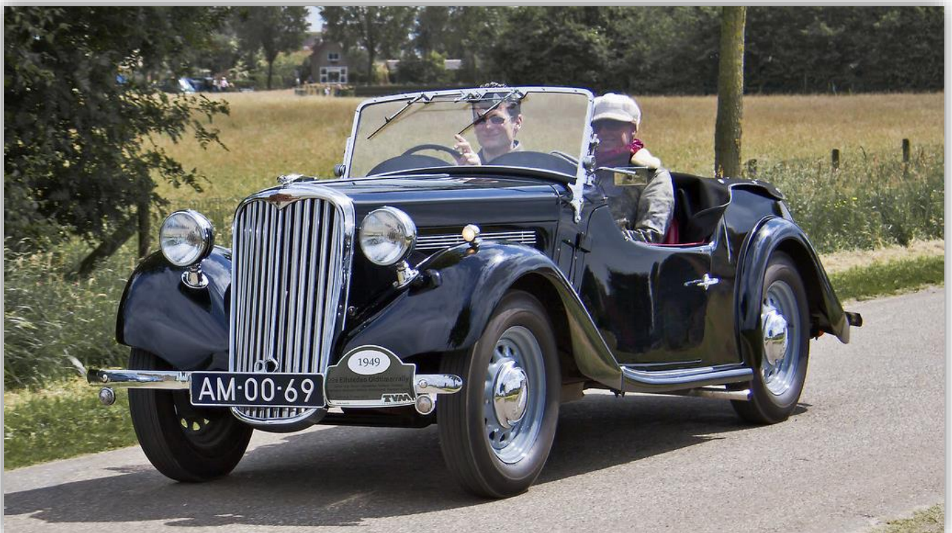
Efterkrigstidens första Nine Roadster var enligt Singer byggd med "förkrigskvalitet", vilket var en fjäder i hatten.

FILM: https://www.youtube.com/watch?v=n6_rt6aDm08 .