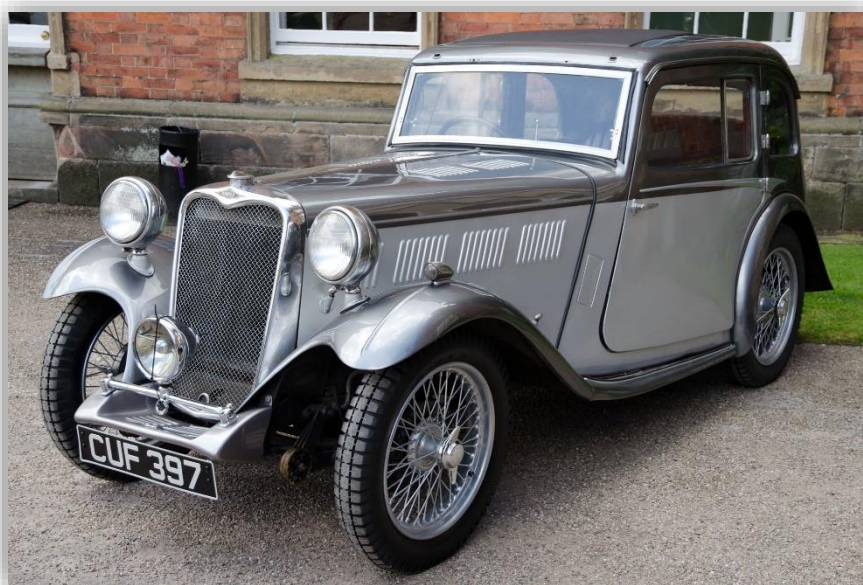
Singer 9 Le Mans Coupe 1936

Under 1930-talet byggdes en mångfald modeller, en del av dem riktigt sportiga, men diversifieringen blev sannolikt för mycket och det var med nöd och näppe Singer klarade sig undan konkurs 1937.