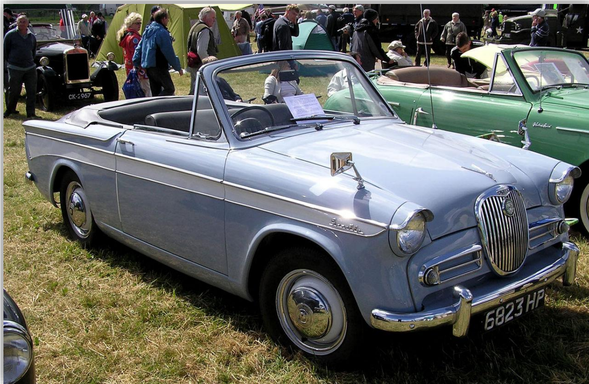
Singer Gazelle IIB Convertible 1960.