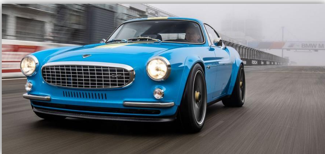
Volvo P1800 Cyan: Svensk restomod