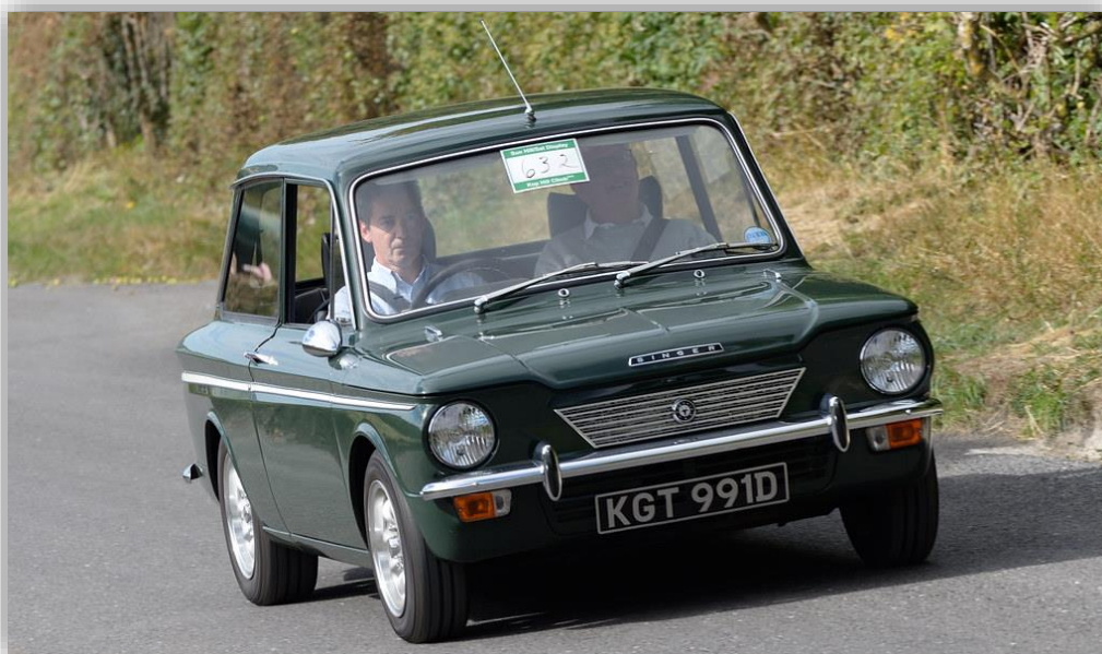
Chamois Sport från 1968/69 var i själva verket en Hillman Imp, en kul svansmotorbil med en hel del tävlingsframgångar på sitt samvete.

Något ägarstöd liknande det som Saab nyligen upplevde var det knappast frågan om. Rootes hade ju för länge sedan tappat de som älskade märket Singer.