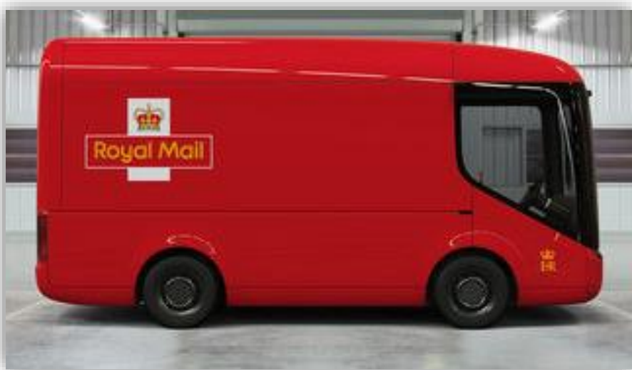
Här är Royal Mails nya postbilar Helt elektriska