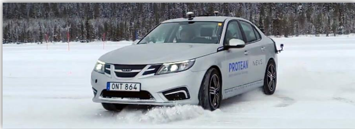
Protean NEVS 93 Winter Testing

Enligt detta nya avtal förvärvade Mini Minor det återstående kapitalet i NEVS för 379,5 miljoner USD och betalades i fyra delbetalningar. National Modern har gått med på att sälja. Vid denna tidpunkt kommer NEVS att bli ett helägt dotterbolag till Evergrande. Samarbetet mellan företagen Evergrande Group och NEVS började den 15 januari 2019, när Evergrande Health förvärvade Mini Minor Limited och dess 51% -andel i NEVS för en total kostnad för 930 miljoner US-dollar . Sedan dess har Mini Minor också tecknat nya aktier i NEVS. Innan tillkännagivandet ägde Mini Minor en andel på 82,4% i NEVS.