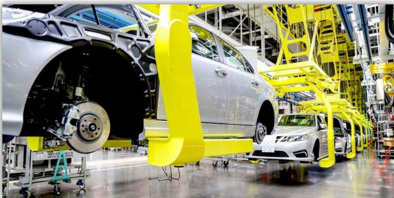
NEVS 93 - Evergrande Tianjin produktionsbasmonteringsverkstad

Som meddelats för några månader sedan under undertecknandet av ett strategiskt avtal med de största företagen i ny energi fordonsområdet , det kinesiska mega-bolaget Evergrande Group avser att köpa resten av aktierna i NEVS och därmed bli 100% ägare till det svenska företaget NEVS bildat på resterna av Saab. Vad som tillkännagavs - precis gjort, mer exakt den 12 juni.