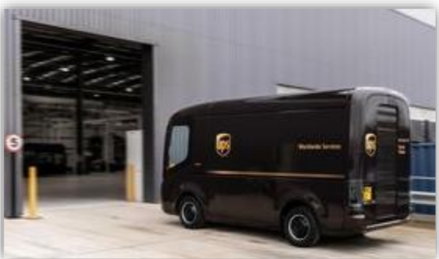
UPS beställer 10.000 elfordon Nu ska de bruna fordonen bli miljövänligare