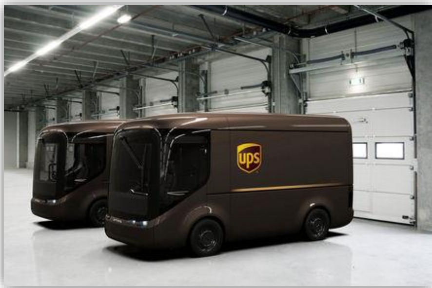
UPS visar upp eldrivna budbilar