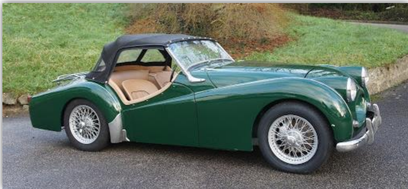
Triumph TR2 1954

Triumph är ett så naturligt varumärkesnamn att det suttit på allt från skrivmaskiner till underkläder, och så bilar förstås! Fyra olika, noga räknat.