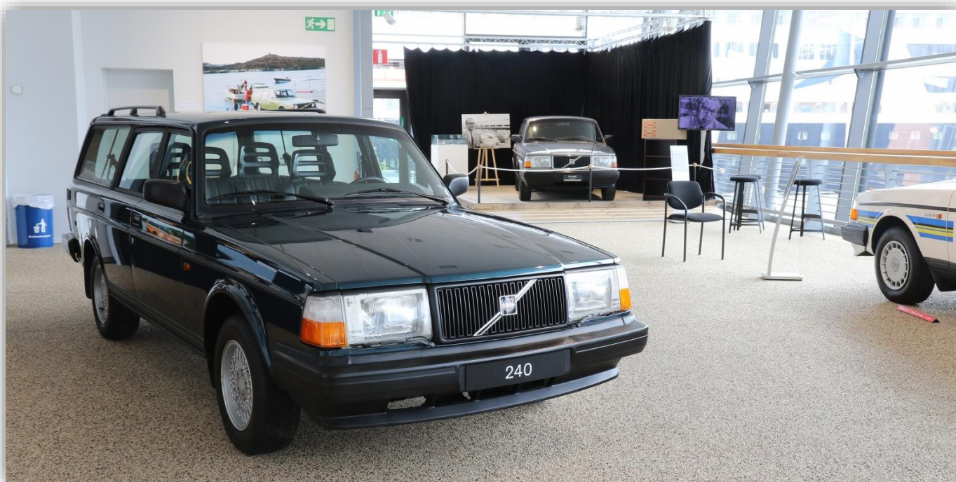
Den allra sist tillverkade 240:n var den här. En 240 Super Polar som många bilarbetare passade på att signera undertill innan den rullade av bandet i maj 1993.

Museets plan var att i slutet av maj presentera en ny specialutställning, men på grund av den pågående coronapandemin så stängde museet för besökare den 23 mars. När man kommer att öppna igen är av naturliga skäl fortfarande oklart, men kanske blir det i början av maj.