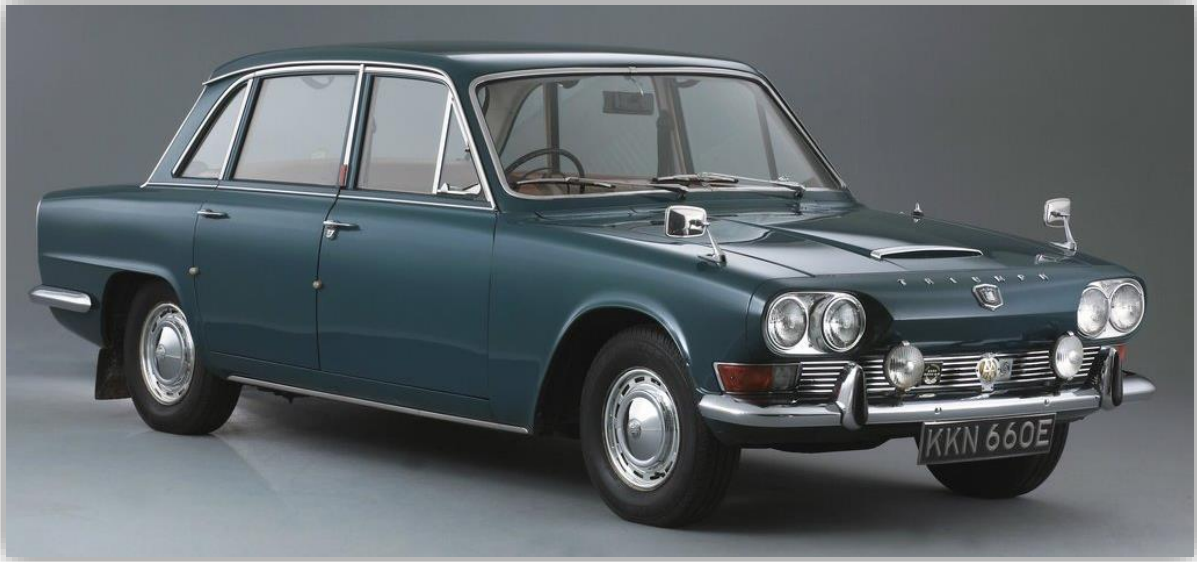
Triumph 2000 Mk1 1967