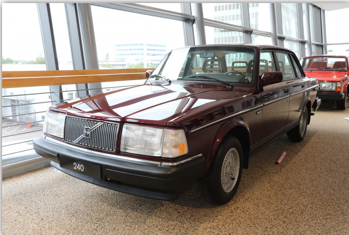
Det här är den näst sist tillverkade bilen, en USA-specificerad 240 Classic som togs direkt till Volvos samling.