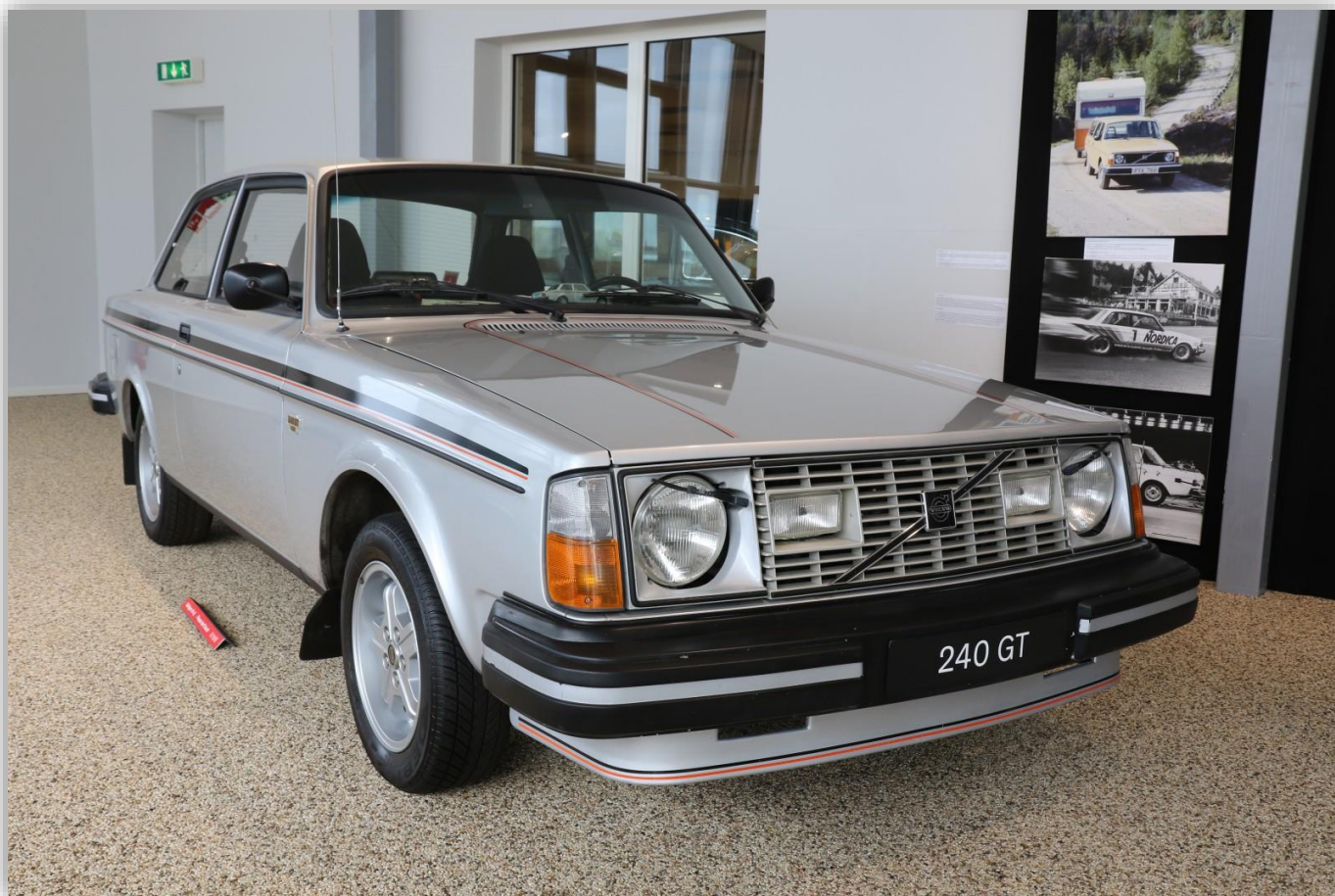
En av de bilar som Volvomuseet lånat in till utställningen är den här extremt fina 242 GT:n från 1979.

I Volvomuseets utställning visades nio bilar upp och besökaren fick mycket påtagligt se Volvo 240 från början till slut. För här fanns den allra först tillverkade bilen och de två sist tillverkade bilarna.