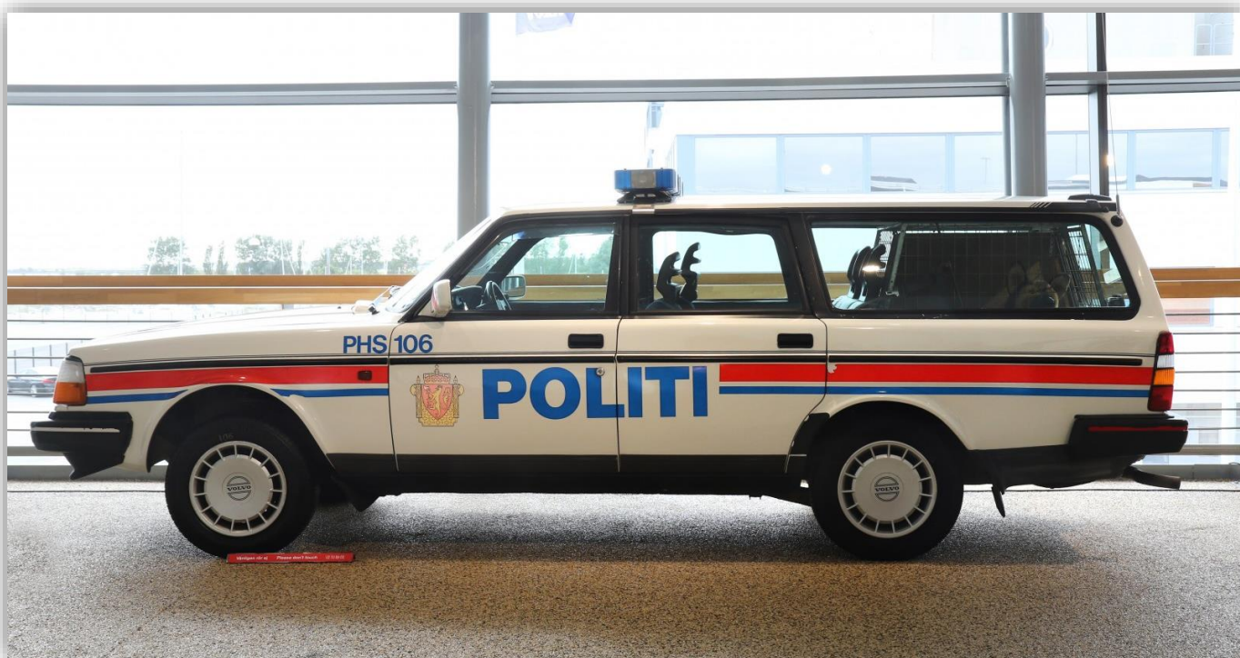
Två polisbilar ställdes ut på utställningen och båda är faktiskt hundpatrullbilar. Det var dels en 240 från polismuseet men också den här norska polisbilen.

I Volvomuseets utställning visades nio bilar upp och besökaren fick mycket påtagligt se Volvo 240 från början till slut. För här fanns den allra först tillverkade bilen och de två sist tillverkade bilarna.