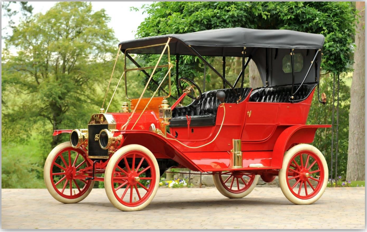
Ford Model T Tourer 1910