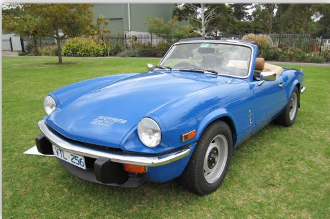
Triumph Spitfire 1500 1974-1981

1962 kom juniorsportvagnen Spitfire, för evigt känd för sina spännande vägegenskaper. Men Spitfire gjorde succé och med alla varianter inräknade byggdes omkring en kvarts miljon exemplar!