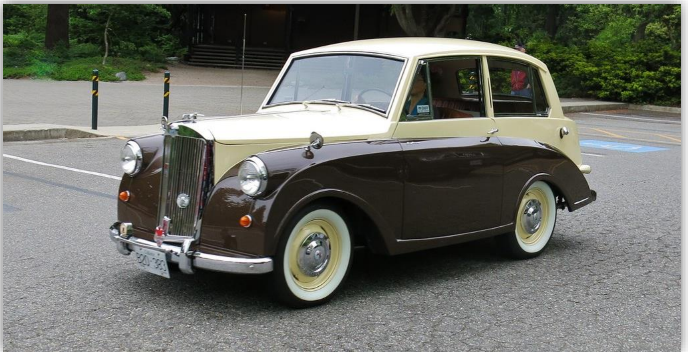
1950 presenterades den besynnerligt kantiga, skarpveckade modellen Mayflower, som också kom att byggas i Nyköping.

Åren 1953–59 byggde Triumph uteslutande sportvagnar, men 1959 presenterades den lilla saloonen Herald, som snart fanns att köpa såväl i coupé/cabriolet-utförande som stationsvagn. Dess fyra cylindrar blev sex i den vassare Vitesse-versionen.