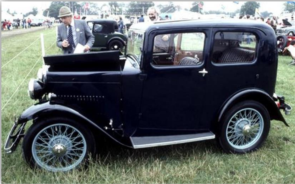
Super Nine från 1932–33 hade en Coventry Climax-fyra på 1 018 cc, fyrväxlad låda, hydrauliska stötdämpare och traditionellt utseende.