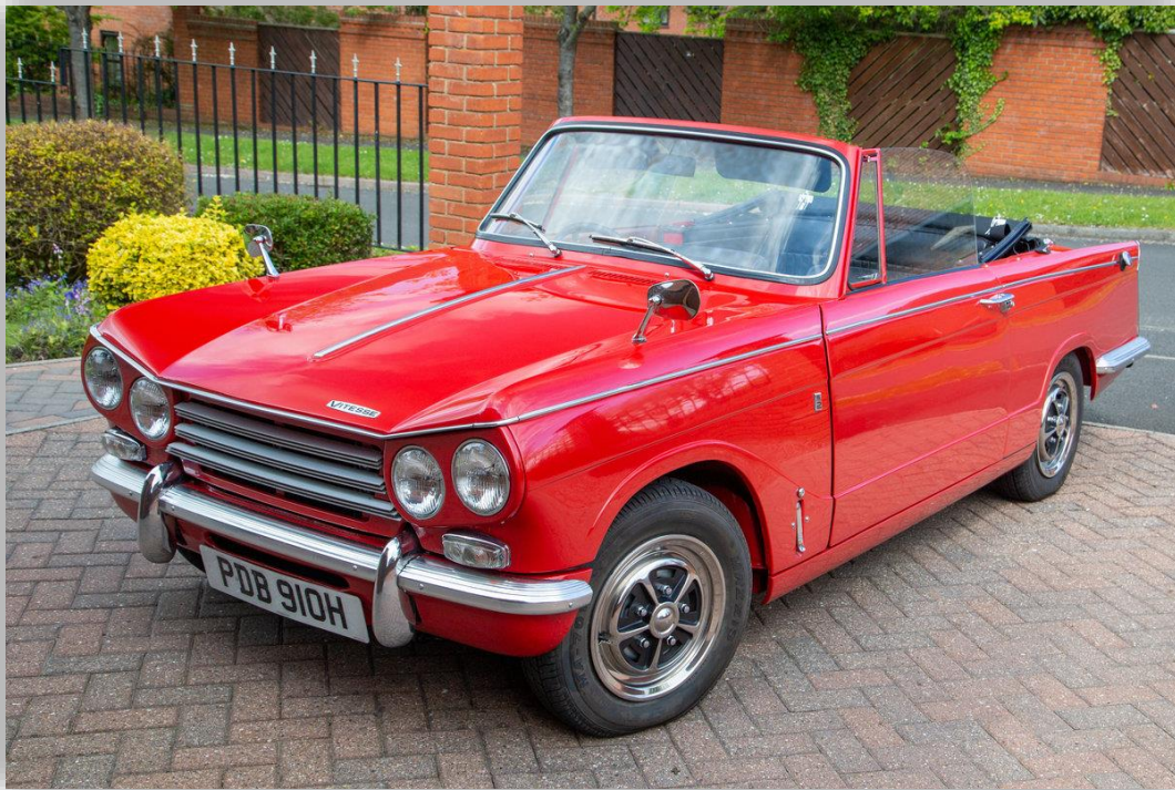
Triumph Vitesse MKII Convertible 1969